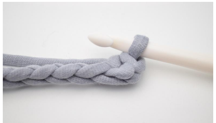
4. Kas näin.