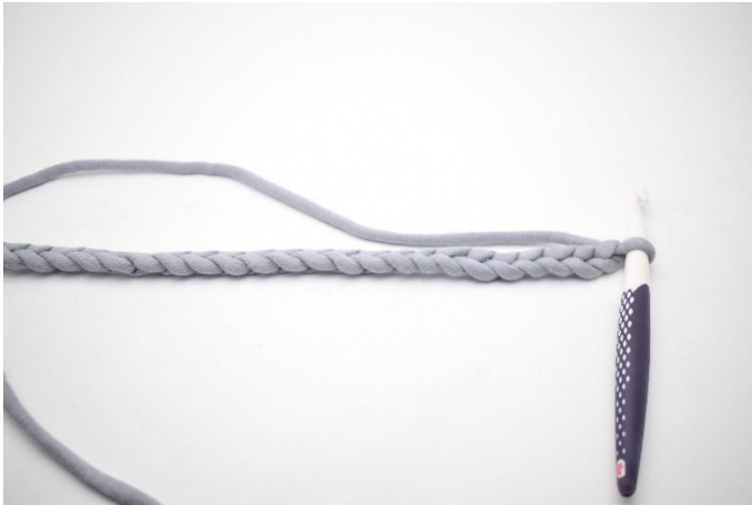
1. Virkkaa kjs:t.