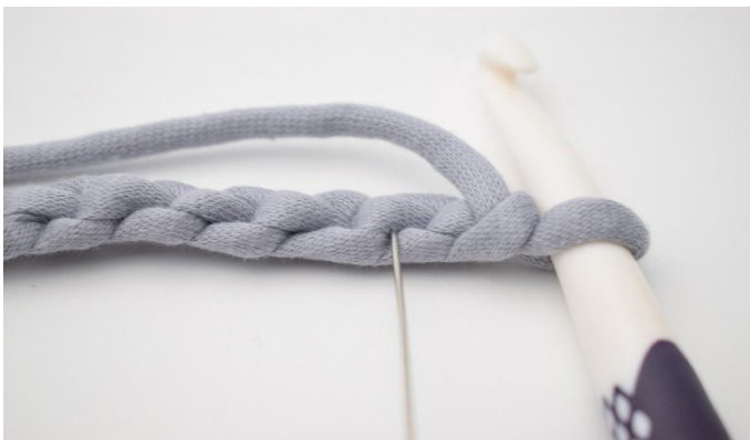
3. Reunasta tulee siistimpi, jos virkkaat ks silmukoiden vaakasuoriin lenkkeihin. Silmukan paikka on kuvassa neulan osoittamassa kohdassa.