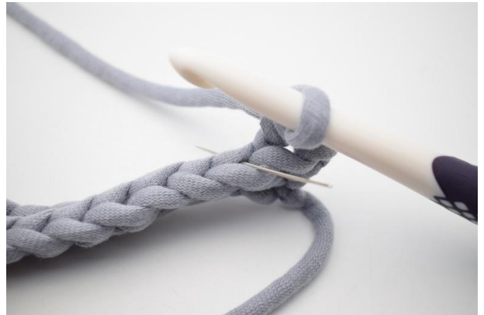
4. Virkkaa 1 ks ensimmäisen s:n tr:aan, neulan osoittamaan kohtaan.