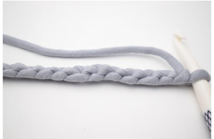
2. Käännä aloitusketjua niin, että silmukoiden ”takapuoli” osoittaa ylöspäin.