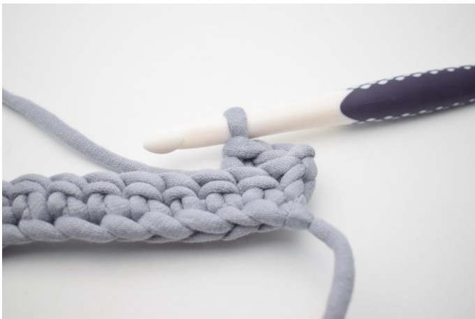
5. Kas näin.