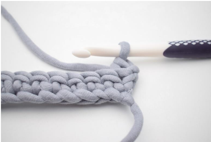
3. Kas näin.