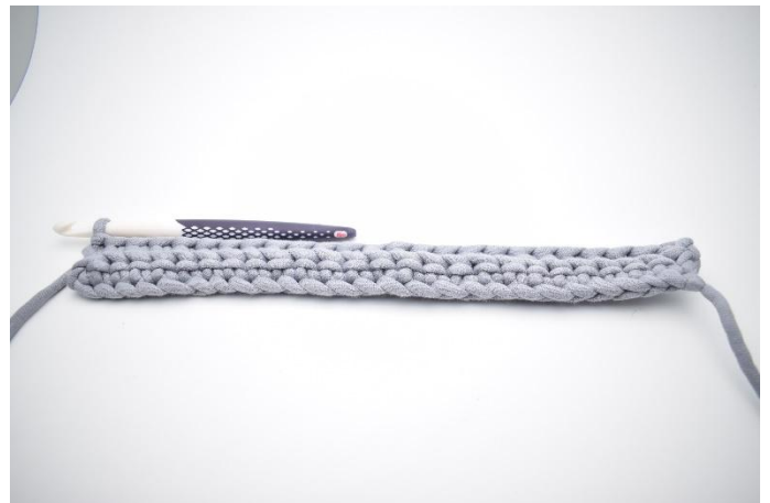
6. Toista kerroksen loppuun saakka.