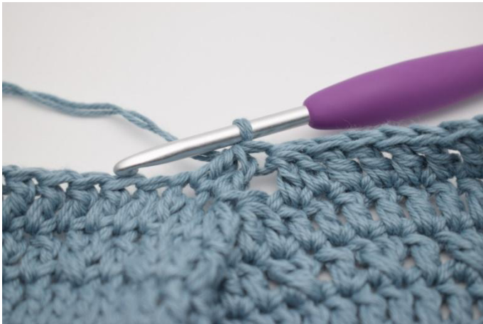
5. Kas näin.