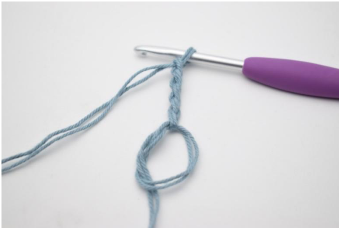
1. Tee al. Virkkaa 5 kjs.