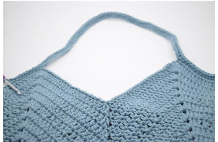
2. Virkkaa ks kerroksen jokaiseen s:aan ja kjs:aan.