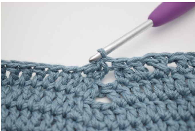
11. Virkkaa 2 p yht.