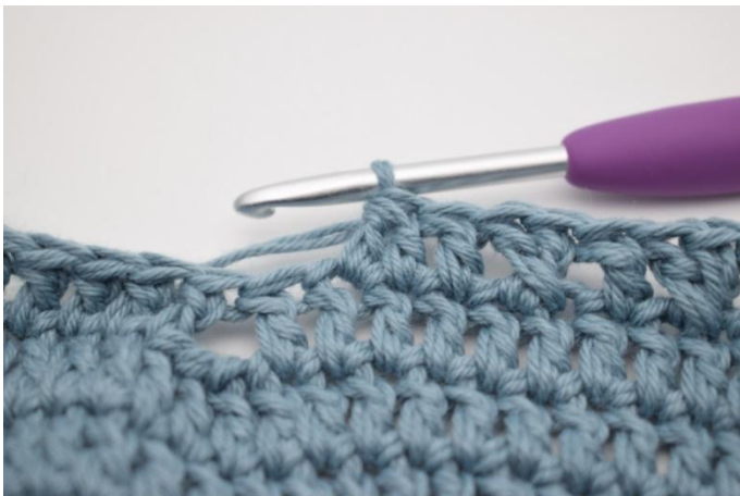
9. Virkkaa 2 p yht.