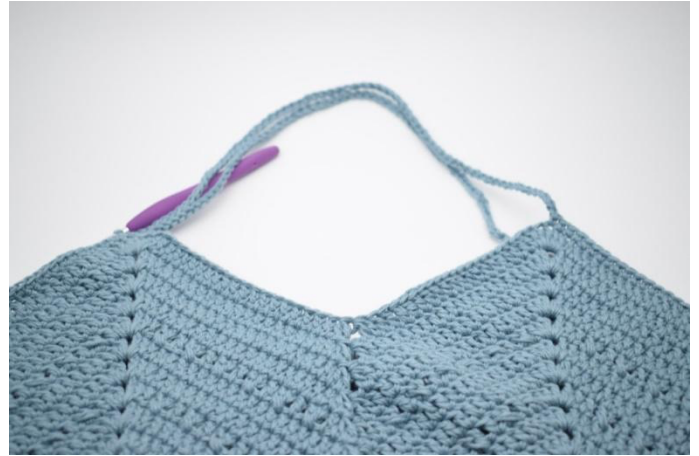
10. Kas näin.