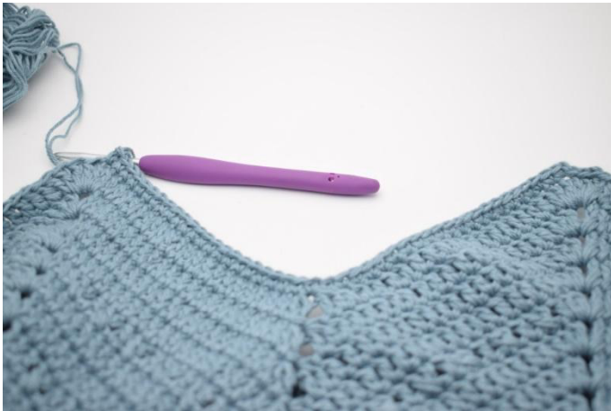
3. Virkkaa 1 kjs. Virkkaa ks seuraaviin 47 s:aan.