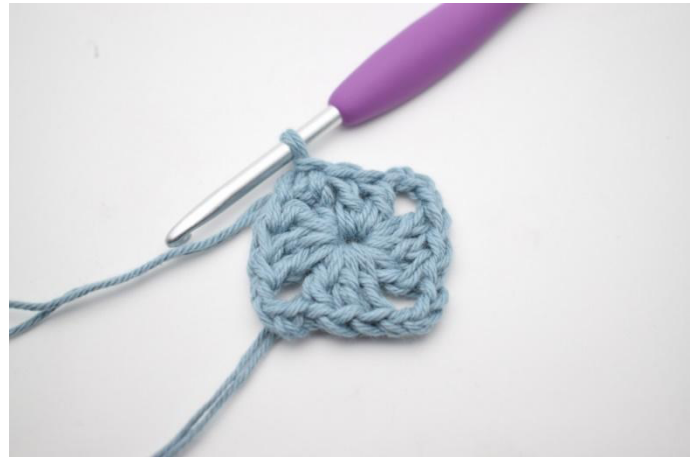
4. Virkkaa 2 p. Päätä kerros virkkaamalla ps kerroksen 3. kjs:aan.