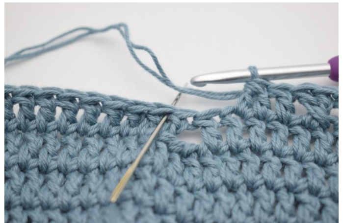
10. Jätä 2 s väliin.