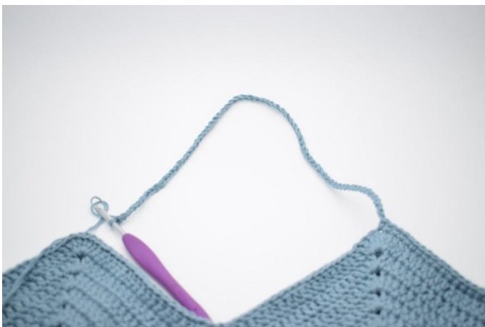
5. Virkkaa 70 kjs ja siirry seuraavaan "kärkeen". I den 4. p af de 6 p i kjs-buen hækles 1 ks.