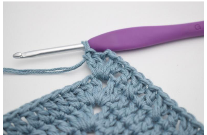
16. Virkkaa 2 p, 2 kjs ja 2 p seuraavaan kjs-kaareen)