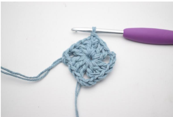
1. Virkkaa 1 ps kjs-kaareen.