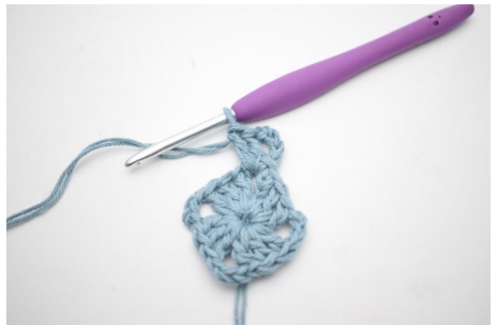
2. Virkkaa 4 kjs. Virkkaa 2 p kjs-kaareen.