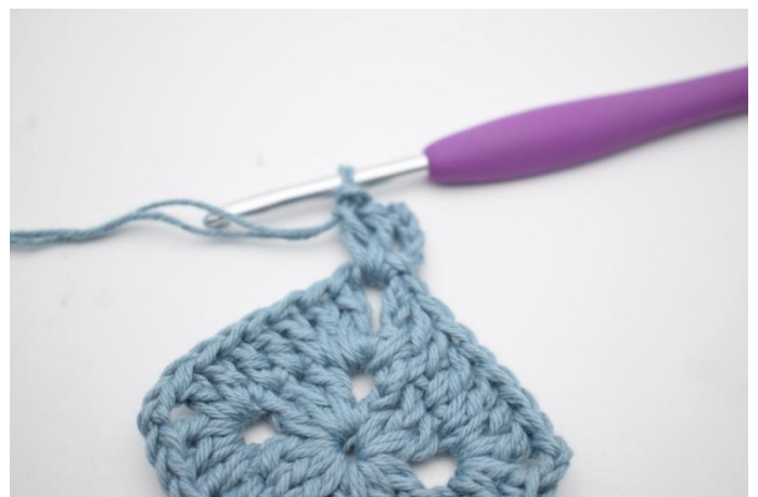
2. Virkkaa 4 kjs. Virkkaa 2 p kjs-kaareen.