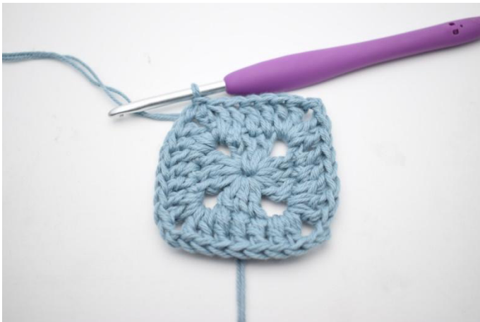
5. Virkkaa 1 p seuraaviin 3 s:aan ja 1 p kerroksen alussa olevaan kjs-kaareen. Päätä kerros virkkaamalla ps kerroksen 3. kjs:aan.