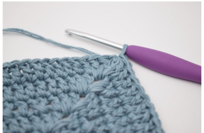
8. Toista joka sivulla. Virkkaa 1 p kerroksen alussa olevaan kjs-kaareen. Päätä kerros virkkaamalla ps kerroksen 3. kjs:aan.