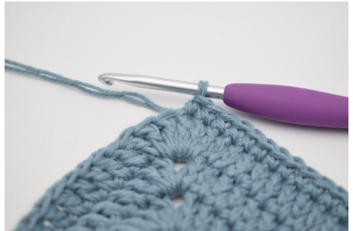
4. Kas näin.