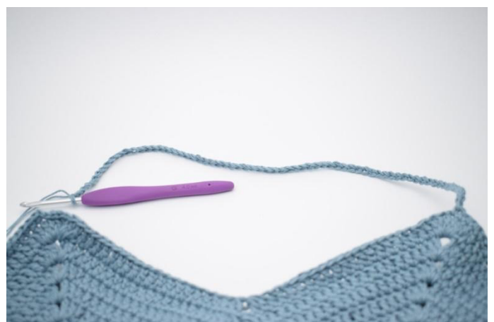
8. Virkkaa 70 kjs ja siirry seuraavaan "kärkeen".