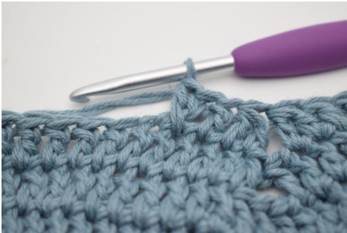
13. Jätä 1 s väliin ja virkkaa 1 p. Virkkaa 1 p väliin jättämäsi s:aan.