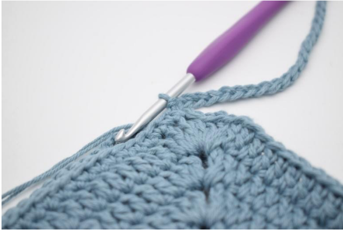
9. Päättä virkkaamalla 1 ps kerroksen alussa olevaan kjs:aan.