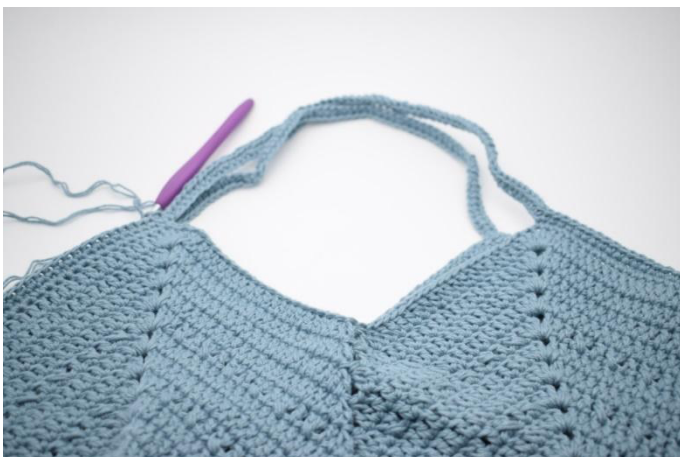
3. Päättä virkkaamalla 1 ps.