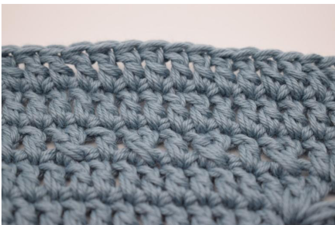
9. Työssä on nyt 1 kuviokerros ja 2 p-kerrosta.