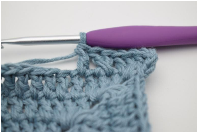
7. Virkkaa 1 p seuraavaan s:aan.