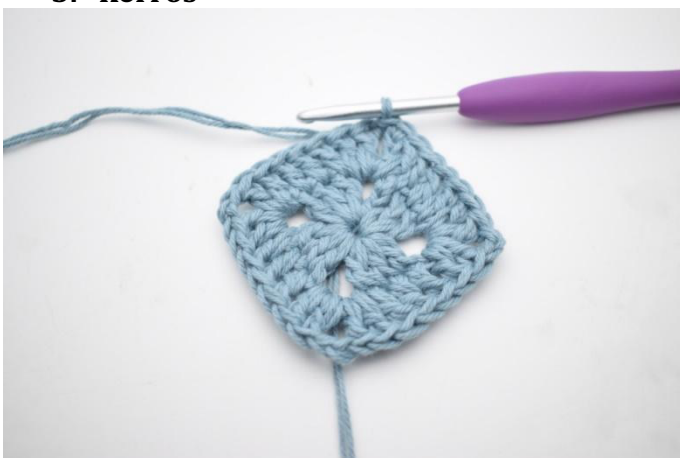
1. Virkkaa 1 ps kjs-kaareen.