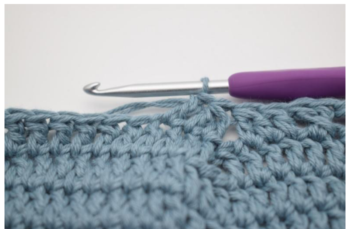
12. Virkkaa 1 p seuraavaan s:aan.