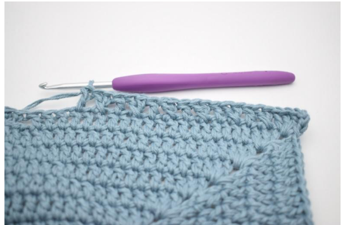
8. "Jätä 1 s väliin ja virkkaa 1 p. Virkkaa 1 pväliin jättämäsi s:aan. Virkkaa 1 p seuraavaan s:aan". Toista "-" 6 kertaa.