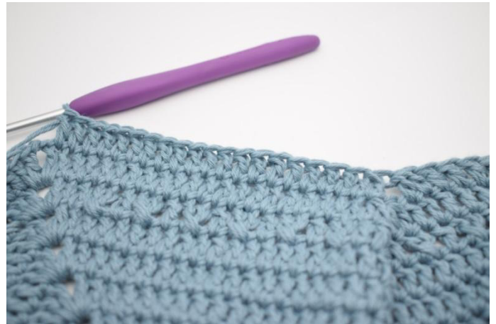
6. Virkkaa 1 p seuraaviin 19 s:aan.