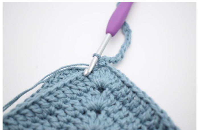
6. Kas näin.