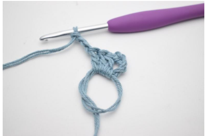
2. Virkkaa "3 p ja 3 kjs".