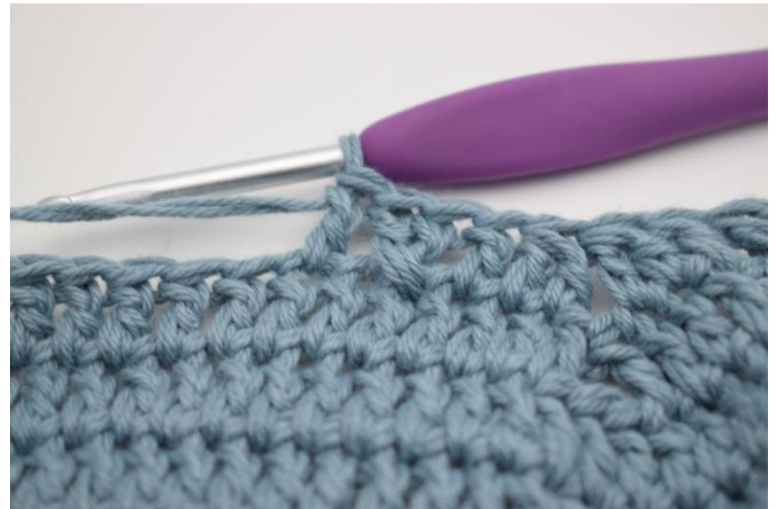
14. Virkkaa 1 p seuraavaan s:aan.