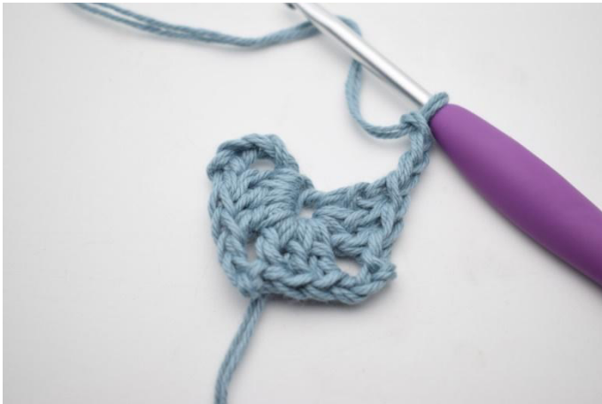
3. Toista "-" yhteensä 3 kertaa.