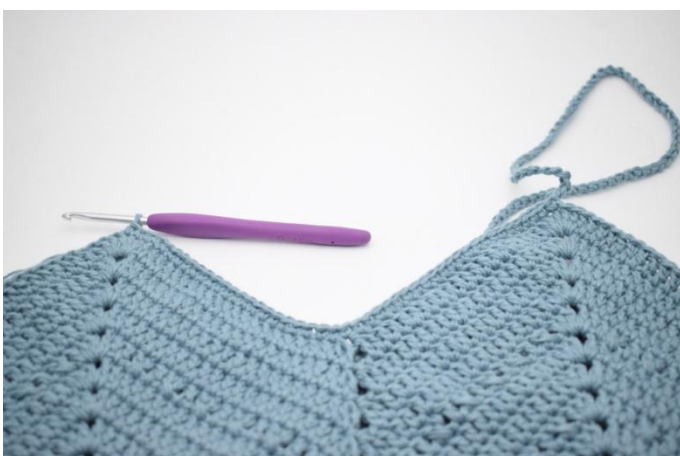
7. Virkkaa ks seuraaviin 46 s:aan.