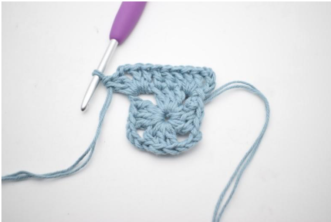
3. Virkkaa "1 p seuraaviin 3 s:aan, 2 p, 2 kjs ja 2 p seuraavaan kjs-kaareen".