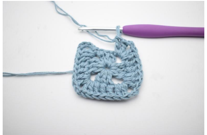
4. Toista "-" yhteensä 3 kertaa.