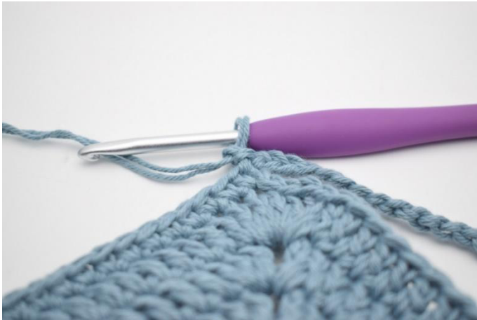
1. Virkkaa 1 kjs.