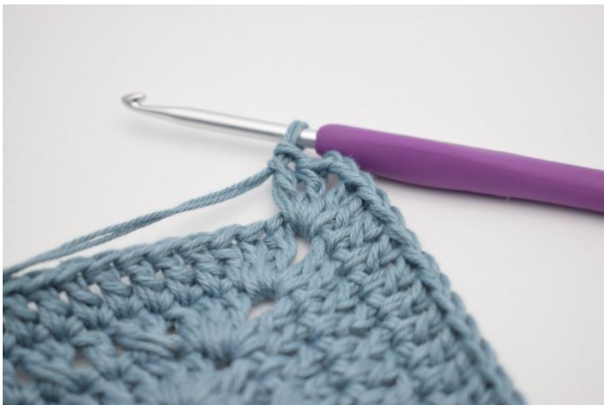
7. Virkkaa 2 p, 2 kjs ja 2 p seuraavaan kjs-kaareen.