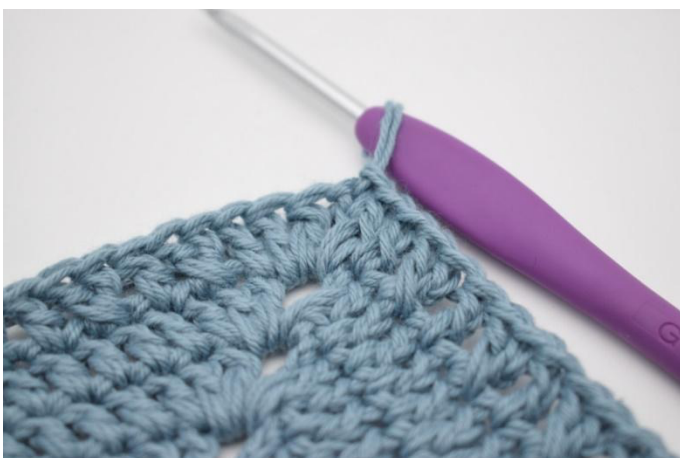
17. Toista joka sivulla. Virkkaa 1 p kerroksen alussa olevaan kjs-kaareen. Päätä kerros virkkaamalla ps kerroksen 3. kjs:aan.