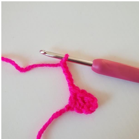
1. Virkkaa 5 kjs.