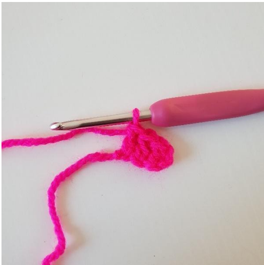
3. Virkkaa p seuraaviin 2 kjs:aan. Olet virkannut ensimmäisen pikselin.