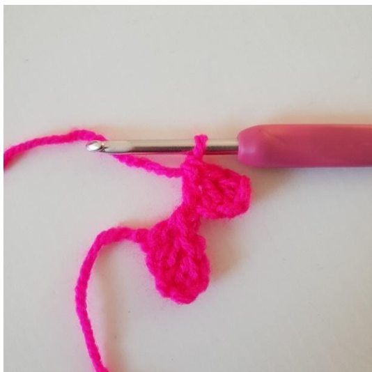
3. Virkkaa p seuraaviin 2 kjs:aan. Olet virkannut toisen pikselin.