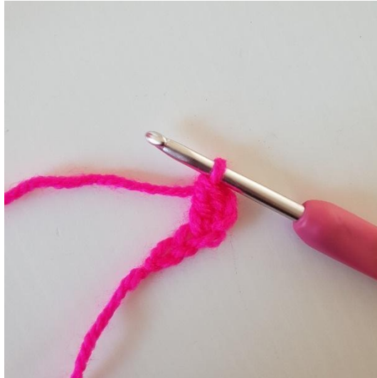
2. Virkkaa 1 p kolmanteen kjs:aan