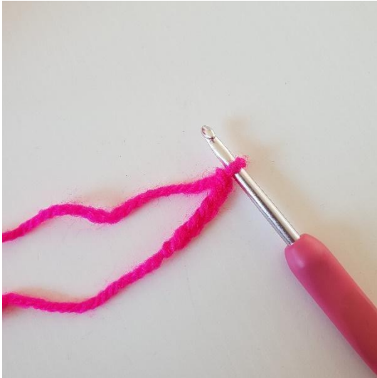
1. Aloita virkkaamalla 5 kjs