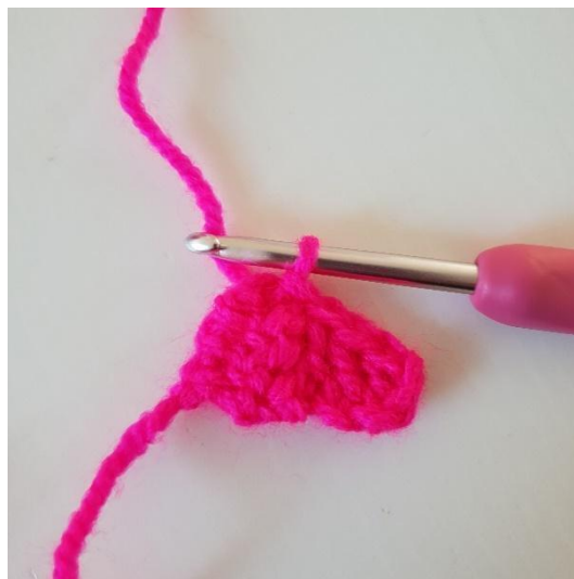
4. Seuraavaksi pikselit virkataan kiinni toisiinsa. Käännä pikseli ja virkkaa ps ensimmäisen pikselin vasemmalle puolelle. Kuvassa on 2 yhteen virkattua pikseliä.