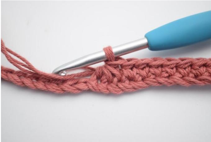
5. Tällä tavalla.