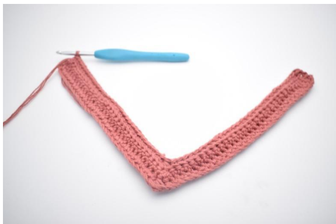
17. Virkkaa ks jäljellä olevien 31 s:n takimmaisiin lenkkeihin.