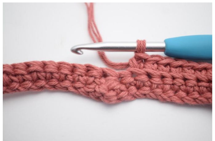
10. Virkkaa ks seuraavien 31 s:n takimmaisiin lenkkeihin.