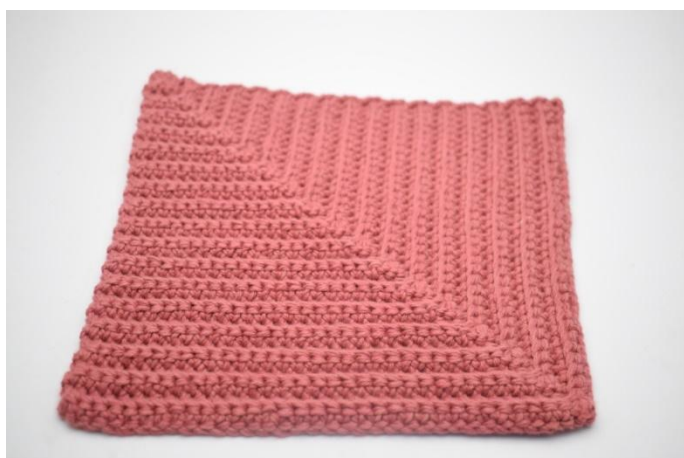
19. Katkaise lanka ja päättele langanpää.