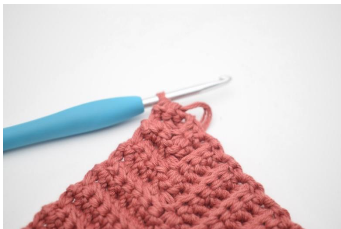
18. Jatka virkkaamista ohjeen mukaan, kunnes jäljellä on 1 s.