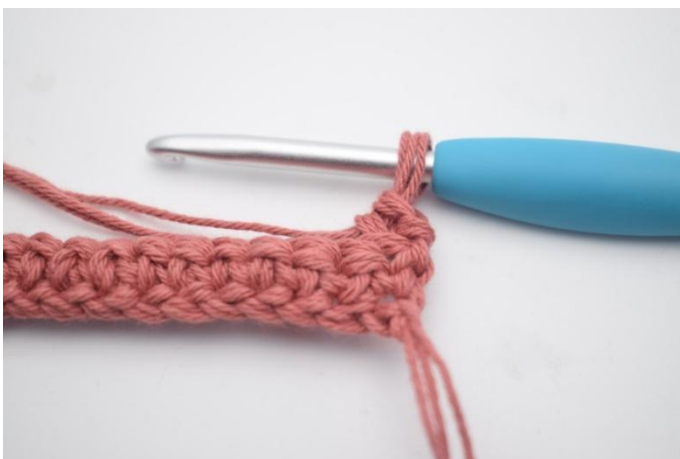
9. Valmis silmukka näyttää tältä.