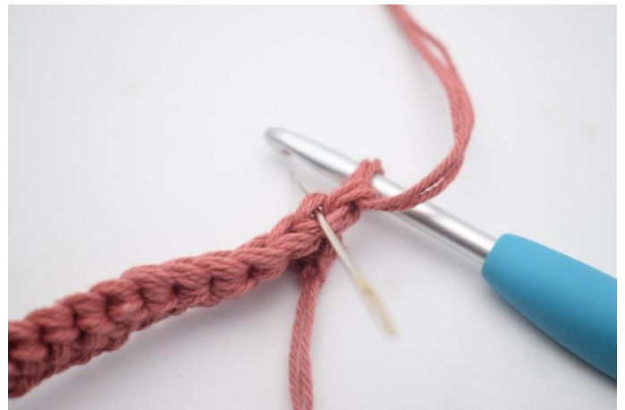
8. Tästä lähtien kaikki silmukat virkataan takimmaisiin lenkkeihin. Virkkaa 1 ks seuraavan s:n takimmaiseen lenkkiin. Oikea kohta on merkitty kuvassa neulalla.