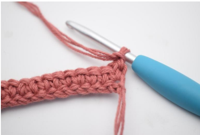
7. Käännä työ virkkaamalla 1 kjs.