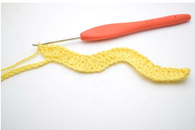
11. Tee 1 p seuraaviin 3 silmukkaan. Tee 3 p seuraaviin 2 silmukkaan.