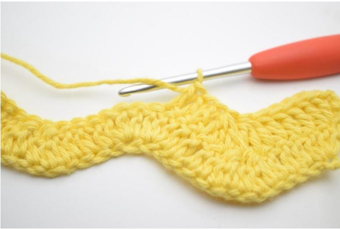
7. Tee 1 p seuraaviin 3 silmukkaan.