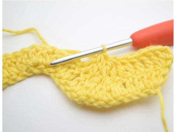
6. Toista ja tee 3 p yhteen seuraavien 3 silmukan kohdalla.