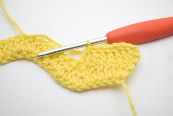
5. Tee 3 p yhteen seuraavien 3 silmukan kohdalla.