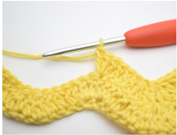
8. Tee 3 p seuraavaan silmukkaan.