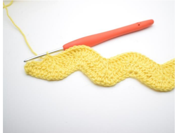
12. Toista tätä kunnes jäljellä on 4 silmukkaa.