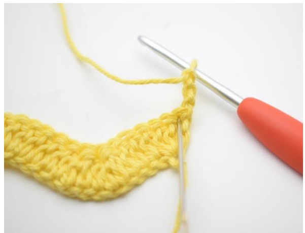
2. Tee 2 p ensimmäiseen silmukkaan.