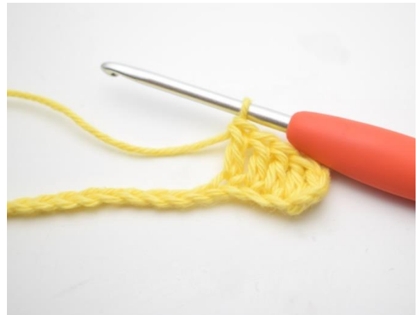
4. Tee 1 p seuraaviin 3 silmukkaan.