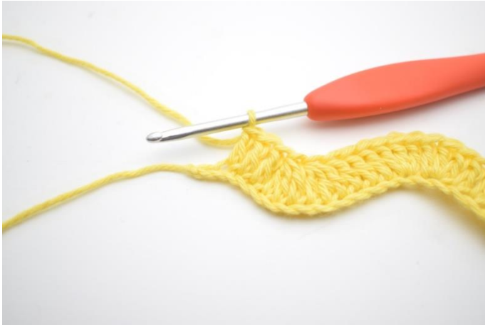
13. Tee 1 p seuraaviin 3 silmukkaan.