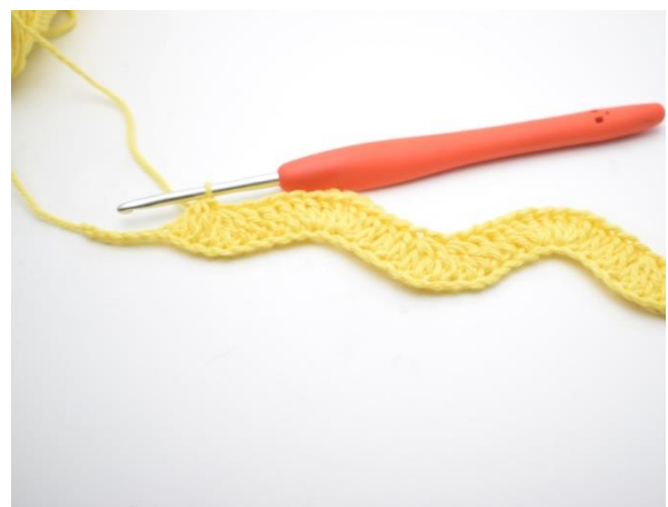
12. Toista tätä kunnes jäljellä on 4 silmukkaa.