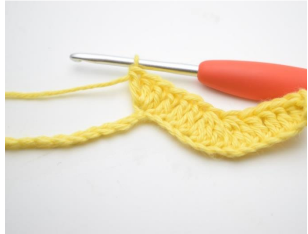
8. Tee 3 p seuraavaan silmukkaan.