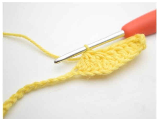
6. Toista ja tee 3 p yhteen seuraavien 3 silmukan kohdalla.