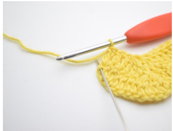
14. Tee 3 p viimeiseen silmukkaan.