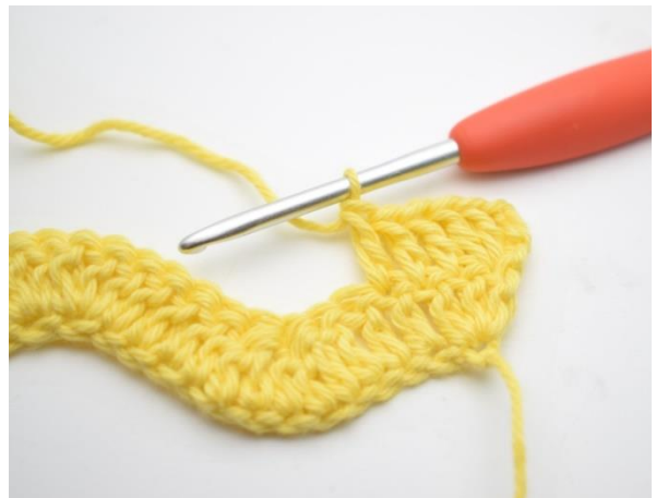
4. Tee 1 p seuraaviin 3 silmukkaan.