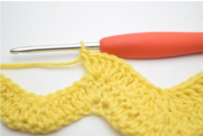
9. Toista ja tee 3 p seuraavaan silmukkaan.