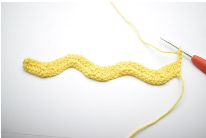
1. Käännä tekemällä 3 kjs.