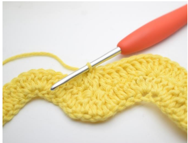
10. Tee 1 p seuraaviin 3 silmukkaan. "Tee 3 p yhteen seuraavien 3 silmukan kohdalla.". Toista merkkien "-" välissä olevaa osiota yhteensä kaksi kertaa.