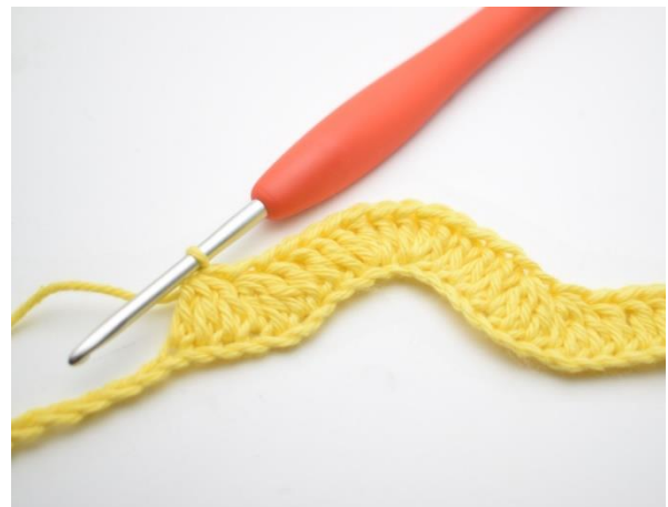
10. Tee 1 p seuraaviin 3 silmukkaan. " Tee 3 p yhteen seuraavien 3 silmukan kohdalla". Toista merkkien "-" välissä olevaa osiota yhteensä kaksi kertaa.