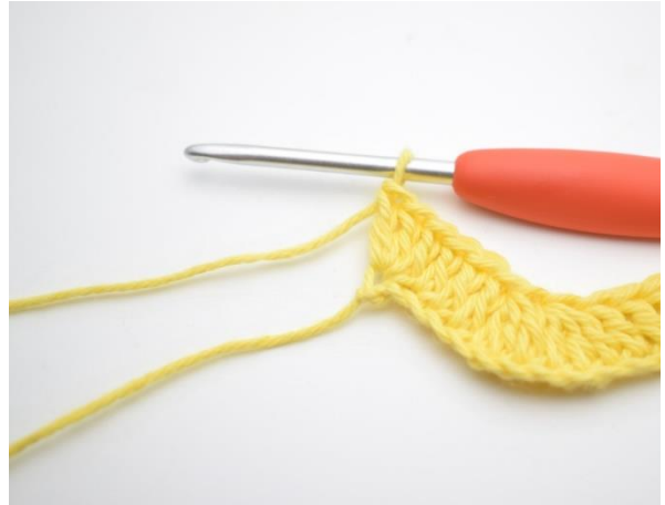
14. Tee 3 p viimeiseen silmukkaan.