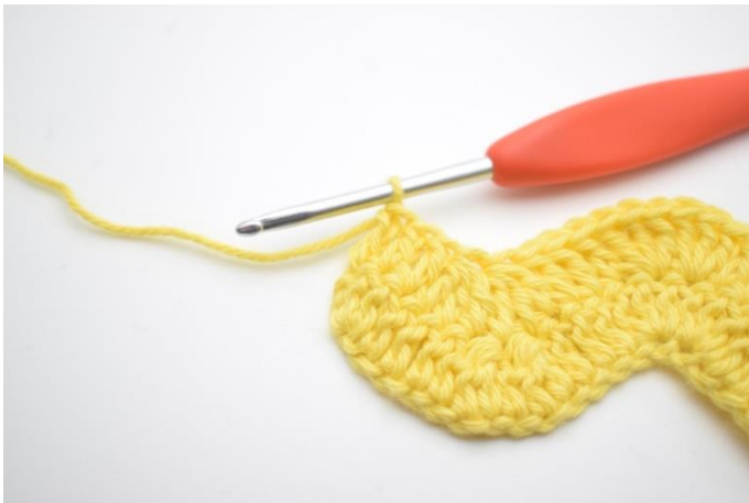
13. Tee 1 p seuraaviin 3 silmukkaan.