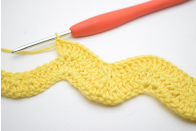
11. Tee 1 p seuraaviin 3 silmukkaan. Tee 3 p seuraaviin kahteen silmukkaan.