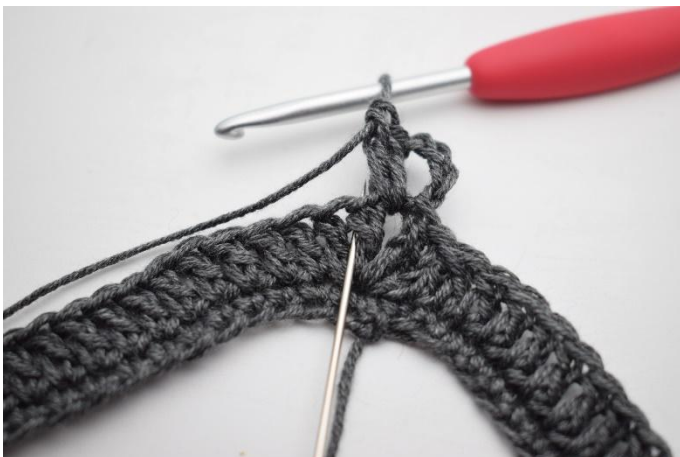
3. Virkkaa 2 p seuraavien 2 p väliin. Silmukan paikka on kuvassa neulan osoittamassa kohdassa.