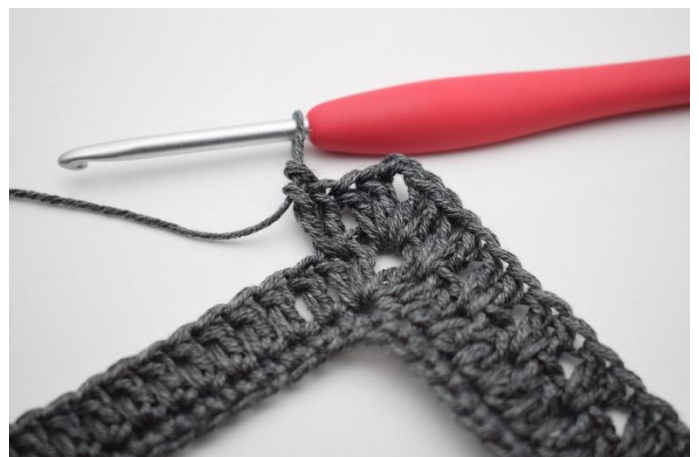
10. Työ näyttää nyt tältä.