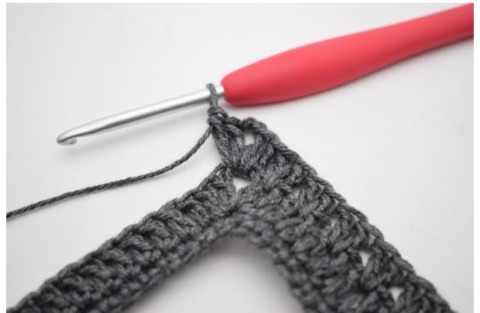
8. Virkkaa 2 p, 2 kjs ja 2 p kjs-kaareen.