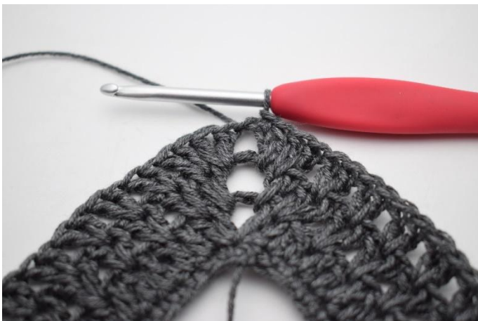
11. Päätä virkkaamalla 1 ps.