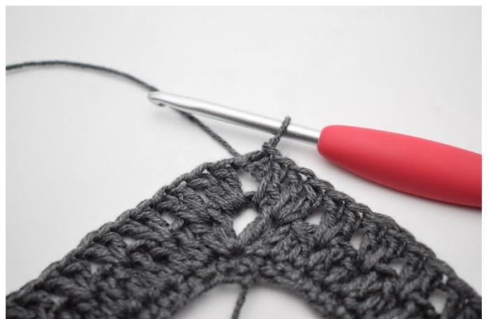
16. Päätä virkkaamalla 1 ps.