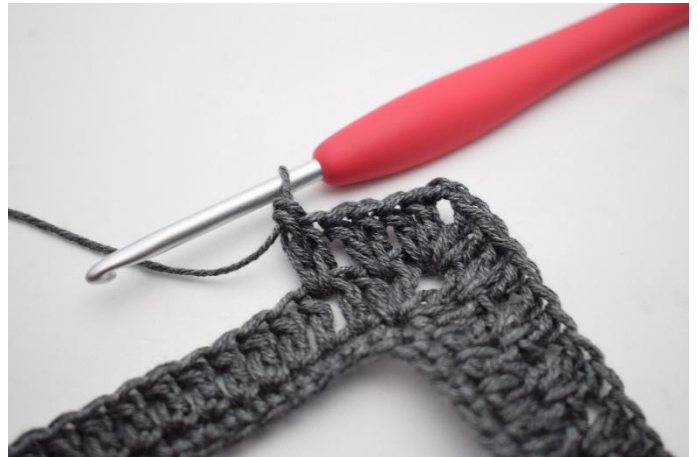
12. Työ näyttää nyt tältä.