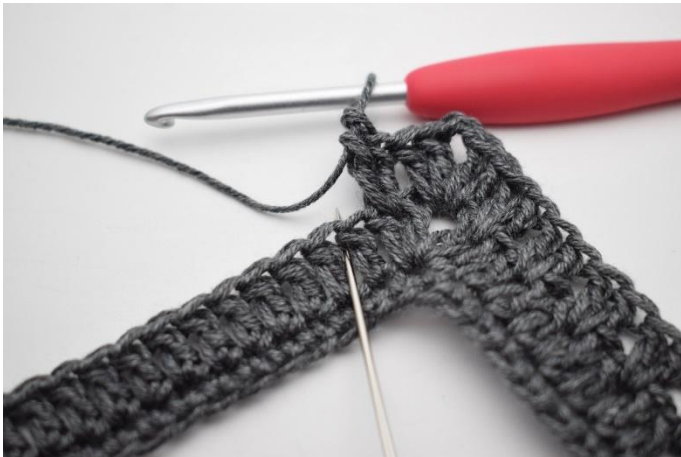
11. Jätä 1 s väliin ja virkkaa 2 p seuraavien 2 p väliin.