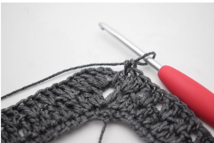
15. Työ näyttää nyt tältä.