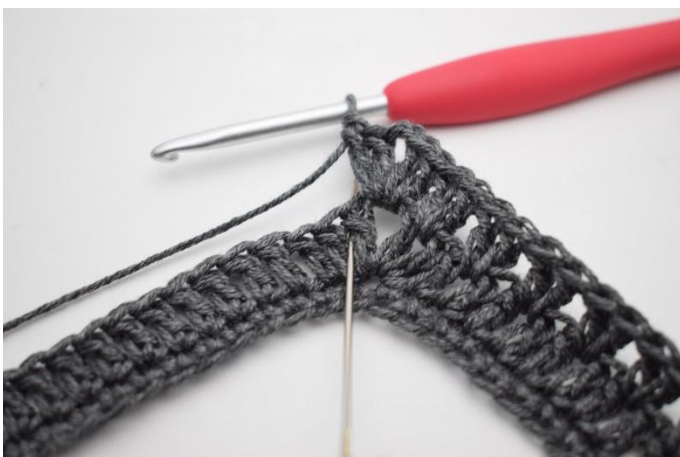
9. Virkkaa 2 p ensimmäisten 2 p väliin. Silmukan paikka on kuvassa neulan osoittamassa kohdassa.