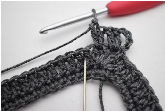
5. Jätä 1 s väliin ja virkkaa 2 p seuraavien 2 p väliin.