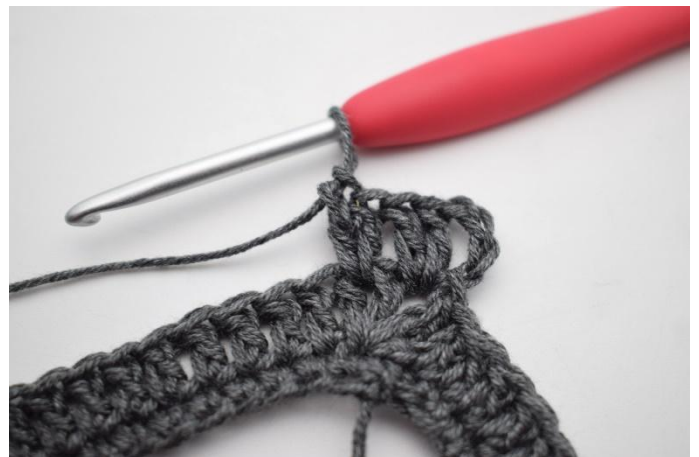
4. Työ näyttää nyt tältä.