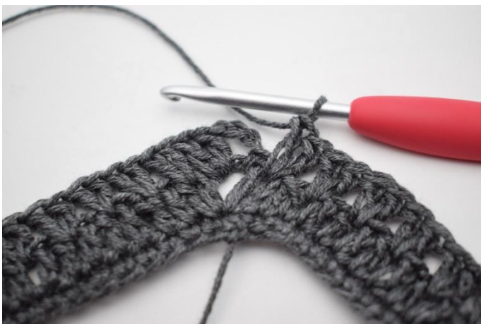
13. Virkkaa "2 p seuraavien 2 p väliin, jätä 1 s väliin". Toista "-" yhteensä 34 kertaa.