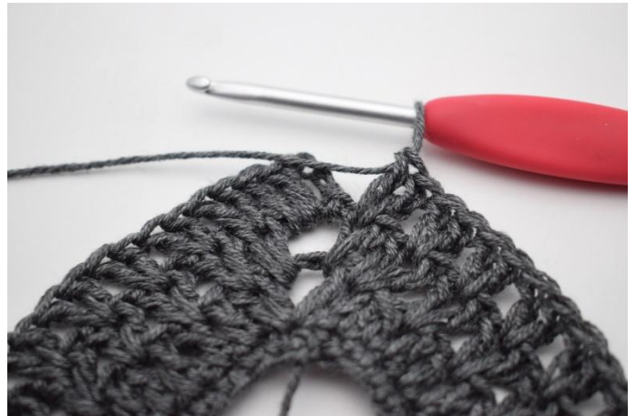
8. Virkkaa "2 p seuraavien 2 p väliin, jätä 1 s väliin". Toista "-" yhteensä 36 kertaa.