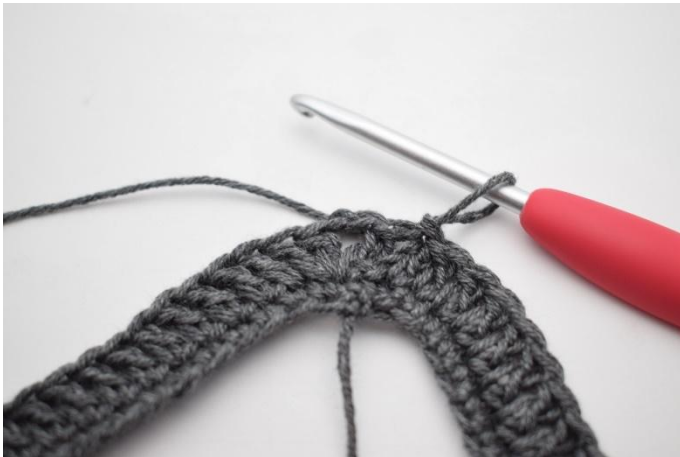
5. Päättä virkkaamalla 1 ps.