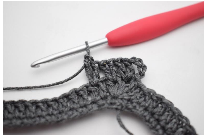
6. Työ näyttää nyt tältä.