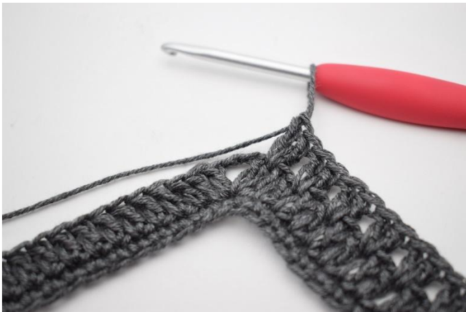
7. Virkkaa "2 p seuraavien 2 p väliin, jätä 1 s väliin". Toista "-" yhteensä 34 kertaa.