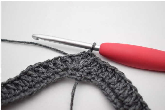
1. Virkkaa ps kjs-kaareen saakka.