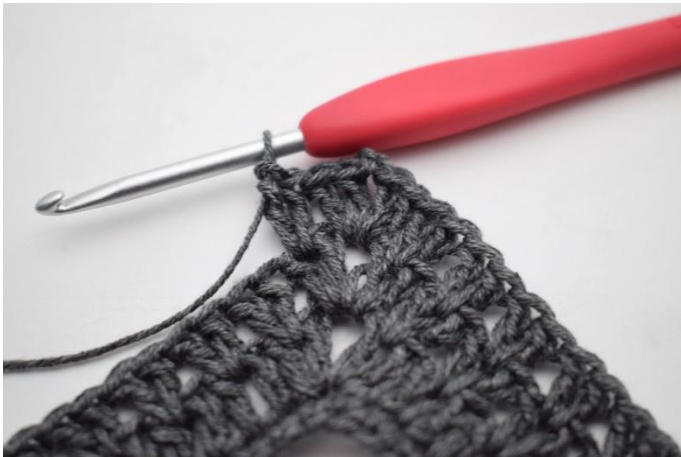
7. Työ näyttää nyt tältä.