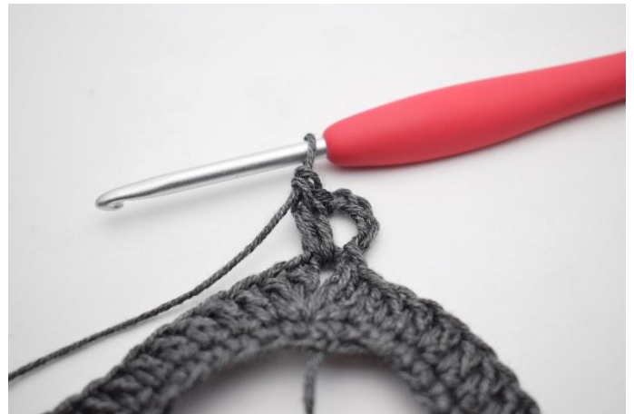
2. Virkkaa 5 kjs ja virkkaa kjs-kaareen 2 p.