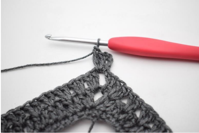
1. Virkkaa ps kjs-kaareen saakka. Virkkaa 5 kjs ja virkkaa kjs-kaareen 2 p.