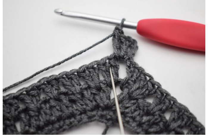
2. Virkkaa 2 p ensimmäisten 2 p väliin.