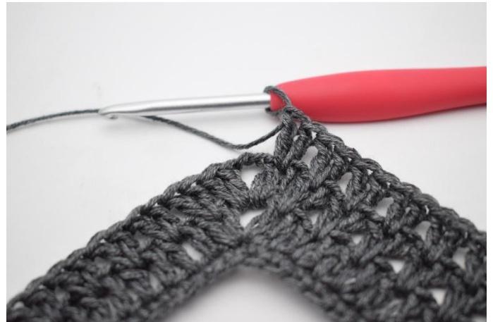
4. Virkkaa "2 p seuraavien 2 p väliin, jätä 1 s väliin". Toista "-" yhteensä 36 kertaa.