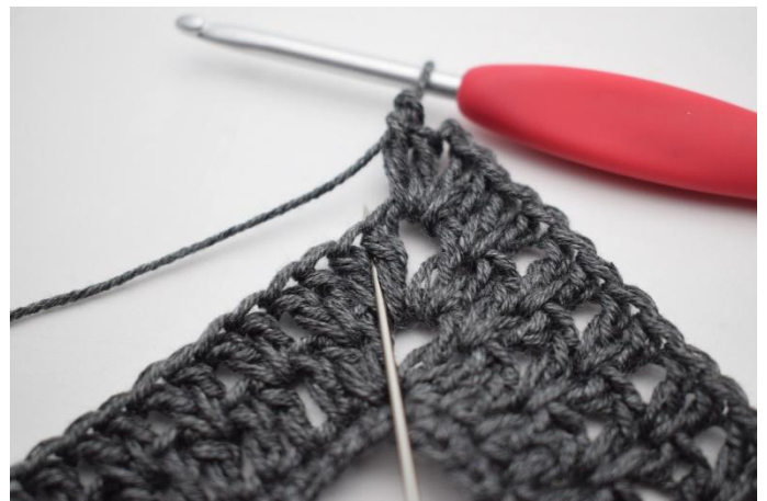
6. Virkkaa 2 p ensimmäisten 2 p väliin.