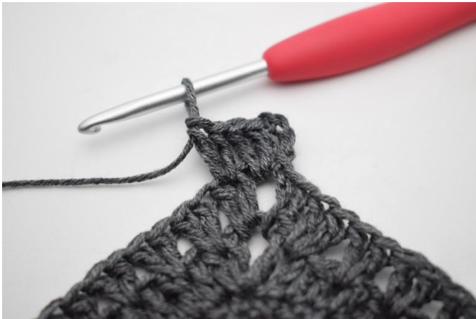
3. Työ näyttää nyt tältä.