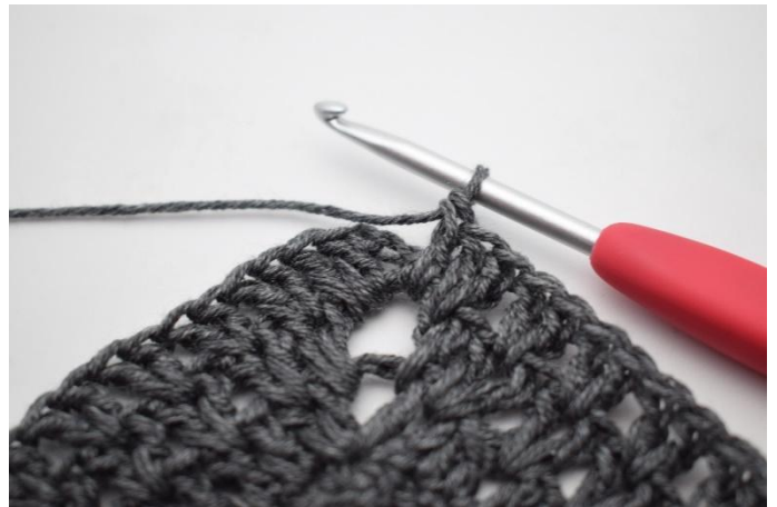
10. Työ näyttää nyt tältä.