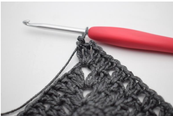
5. Virkkaa 2 p, 2 kjs ja 2 p kjs-kaareen.