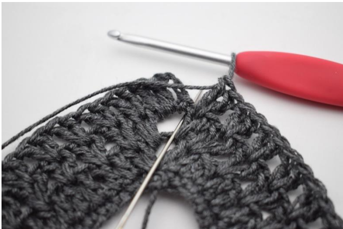
9. Virkkaa 1 p kerroksen alun kjs-kaareen.