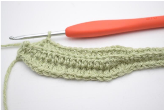
3. Virkkaa 1 ½-p seuraaviin 11 (15) s:aan.