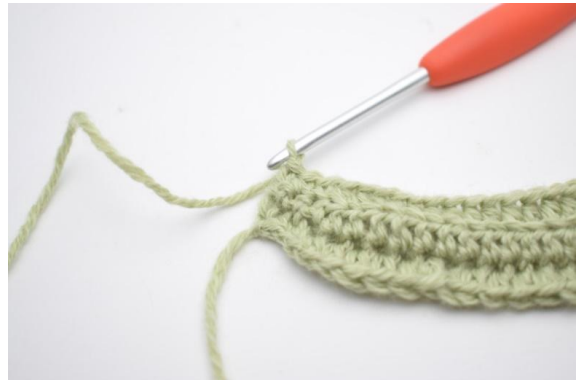
4. Virkkaa 1 ks viimeisiin 2 (3) s:aan.