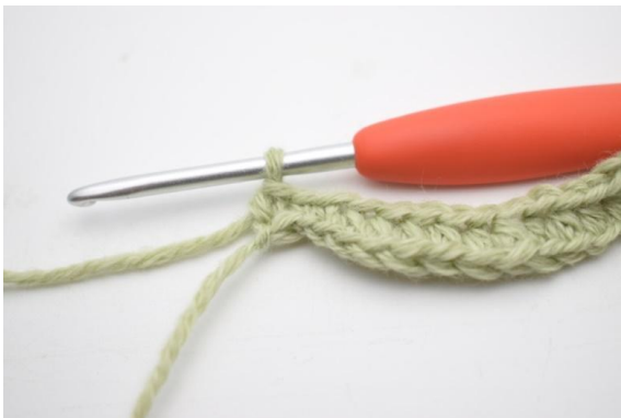
7. Virkkaa 1 ks viimeisiin 2 (3) kjs:aan.