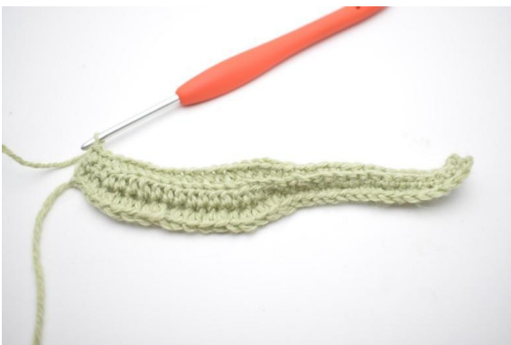
5. Valmis kerros näyttää tältä.