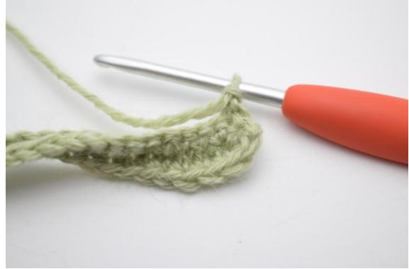
2. Virkkaa 1 ks ensimmäisiin 12 (17) s:aan.