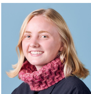
Kauluri puoliksi taiteltuna