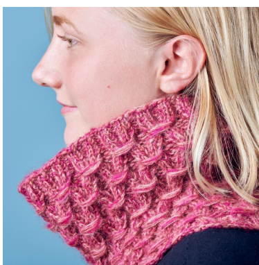
Kauluri auki taiteltuna