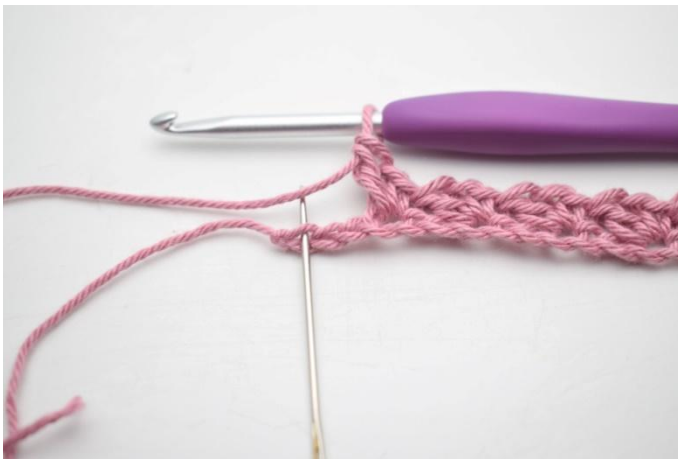
9. Jätä 2 kjs väliin ja virkkaa 1 ks viimeiseen silmukkaan.