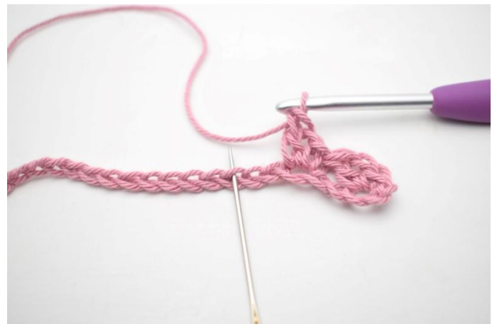
6. *Jätä 2 kjs väliin ja virkkaa 1 ks, 1 kjs, 1 p seuraavaan silmukkaan*.