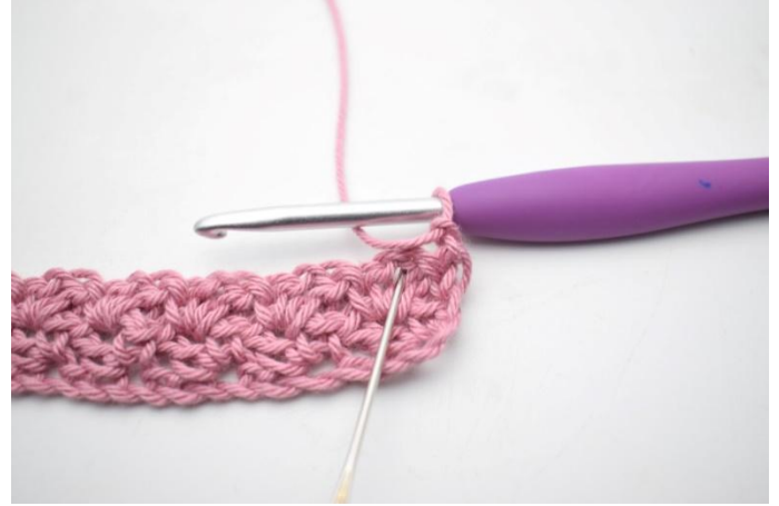
20. *Virkkaa 1 ks, 1 kjs ja 1 p edellisen kerroksen ketjukaareen*.