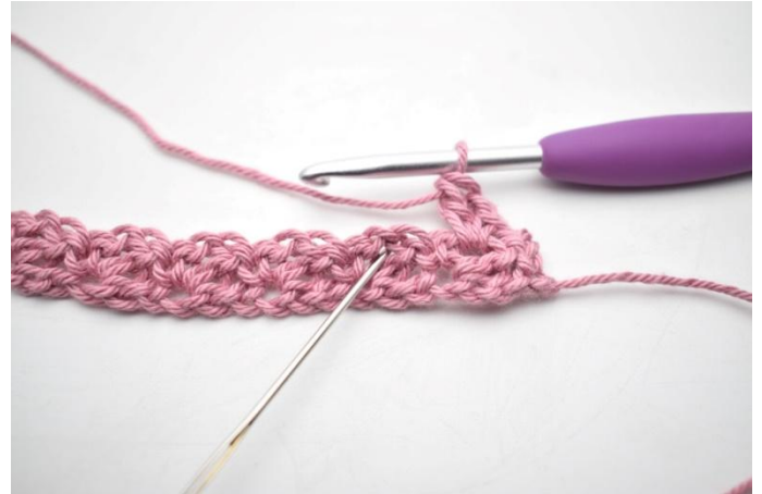
14. *Virkkaa 1 ks, 1 kjs ja 1 p edellisen kerroksen ketjukaareen*.