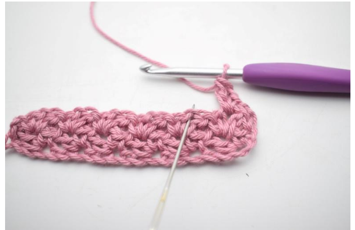
22. *Virkkaa 1 ks, 1 kjs ja 1 p edellisen kerroksen ketjukaareen*.