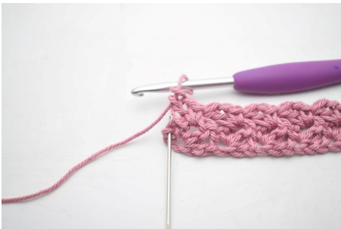
17. Virkkaa 1 ks viimeiseen silmukkaan.