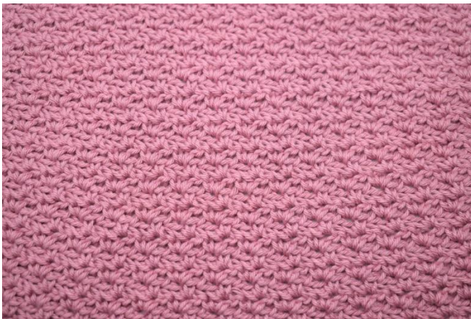
27. Toista kerros 2. kunnes sinulla on yhteensä 43 kerrosta. Katkaise lanka ja päättele langanpäät työhön.