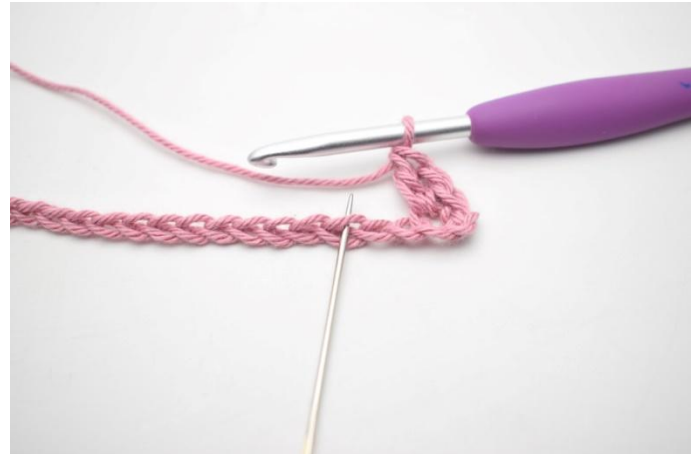
4. *Jätä 2 kjs väliin ja virkkaa 1 ks, 1 kjs ja 1 p seuraavaan silmukkaan*.