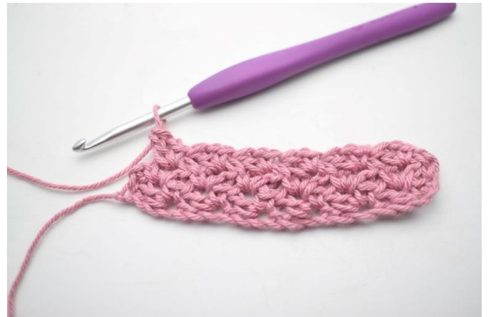
24. Toista *_* kerroksen loppuun asti.