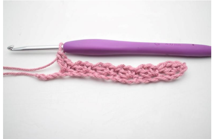
8. Toista *_* kunnes sinulla on 3 kjs jäljellä.