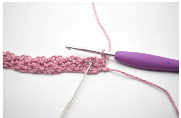
12. *Virkkaa 1 ks, 1 kjs ja 1 p edellisen kerroksen ketjukaareen*.