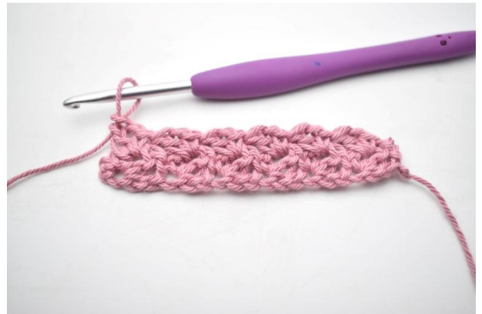
16. Toista *_* kerroksen loppuun asti.