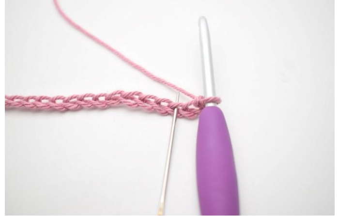
2. Virkkaa 1 ks, 1 kjs ja 1 p koukulta katsottuna kolmanteen ketjusilmukkaan.