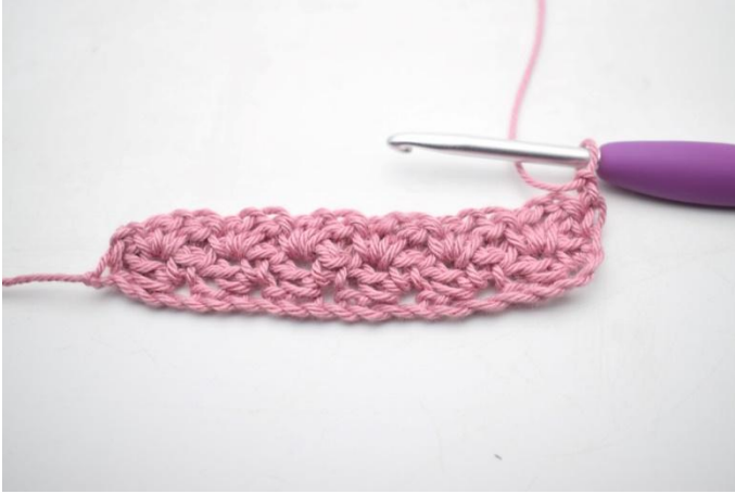
19. Virkkaa kuten 2. kerros. Käänny luomalla 1 kjs.