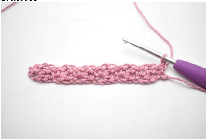
11. Käänny luomalla 1 kjs.