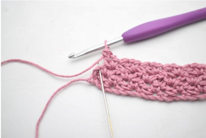
25. Virkkaa 1 ks viimeiseen silmukkaan.