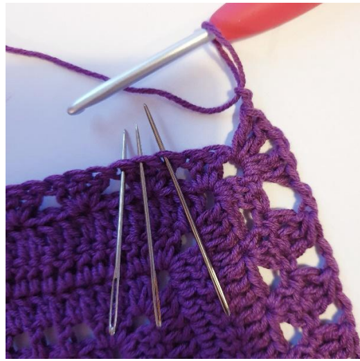
[2 kjs, 3 p yht, 2 kjs], toista