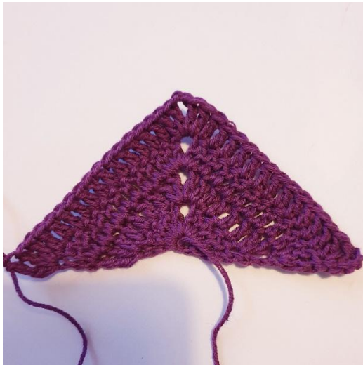
[2 p, 1 pp] kääntymisketjuun