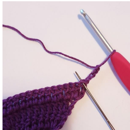
Virkkaa 4 kjs ja käännä työ

Huom: Kerrokset 3 ja 4 ovat samanlaisia kuin kerros 2, mutta kärjessä on vain enemmän silmukoita. Tämän vuoksi kuvaohje jatkaa 5. Kerrokseen.