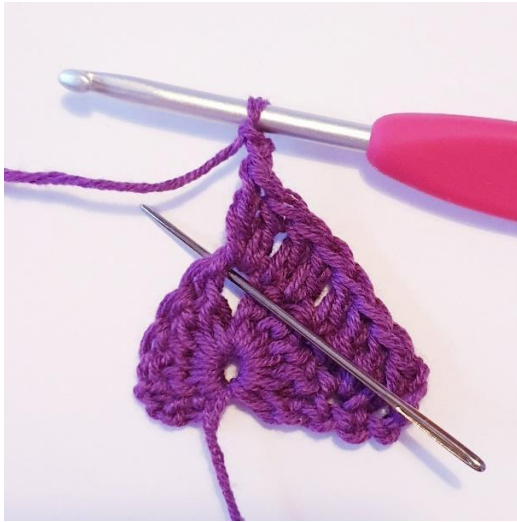
[2 p, 2 kjs, 2 p] kärkeen