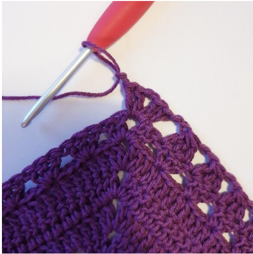
[2 p, 2 kjs, 2 p] kärkeen