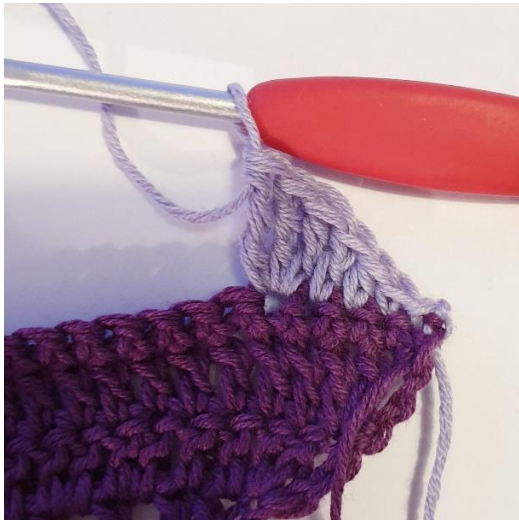
3 pp samaan s:aan,