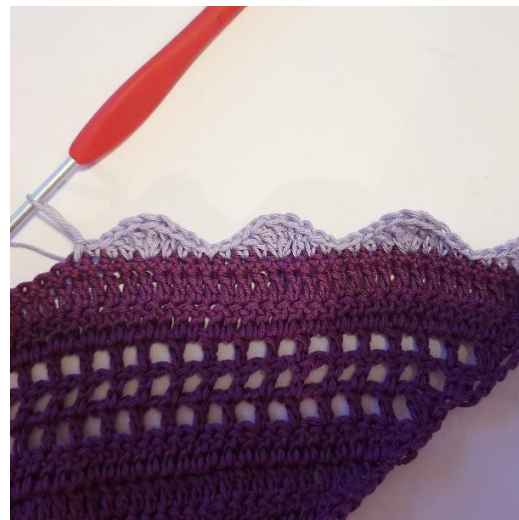
[1 ks, 1 1/2-p, 1 p, 3 pp samaan s:aan, 1 p, 1 1/2-p, 1 ks, 1 ps], toista