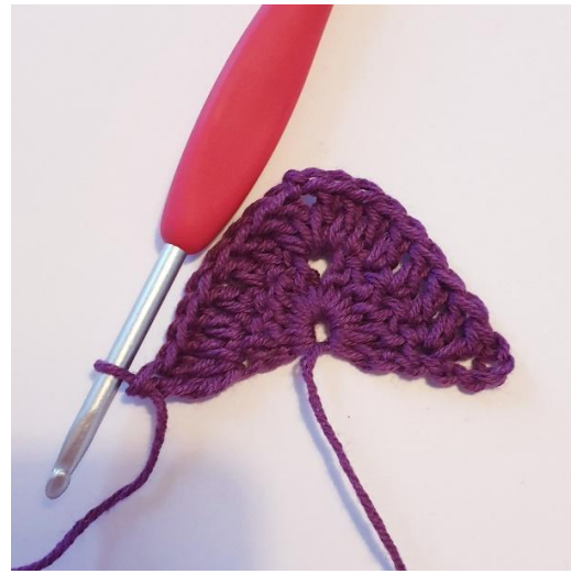
1 p seuraaviin 4 s:aan