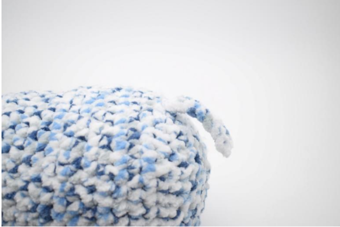
3. Ompele häntä elefantin takapuolelle.