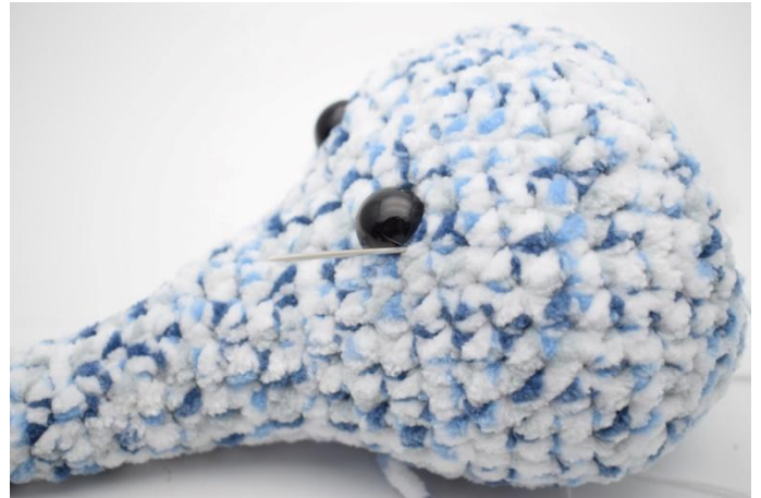
2. Luo silmäkuopat neulan ja valkoisen langan avulla. Vedä neula silmäkulman läpi.