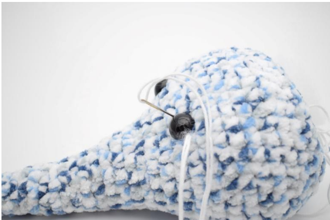
3. Vie neula silmän toiselle puolelle ja vie neula pään läpi tiukentaen lankaa.