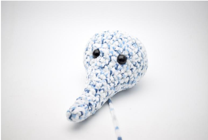
1. Täytä kärsä ja pää.

Täytä kärsä ja pää kiinteiksi. Luo silmäkuopat.