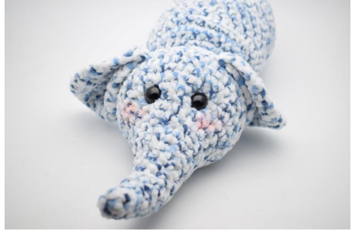
4. Lisää hieman punaa poskille.