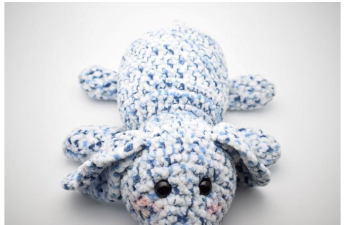
6. Kuten näin.