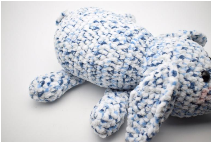
5. Ompele jalat elefantin vatsan alle.