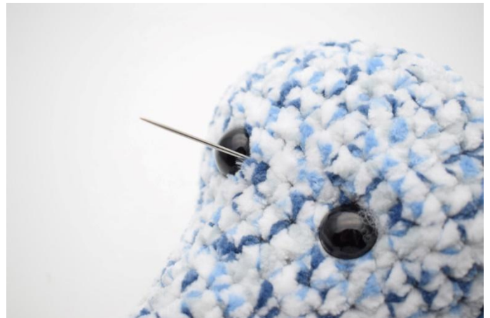
4. Vie neula pään läpi, niin että pää tulee ulos toisen silmän kulmasta.