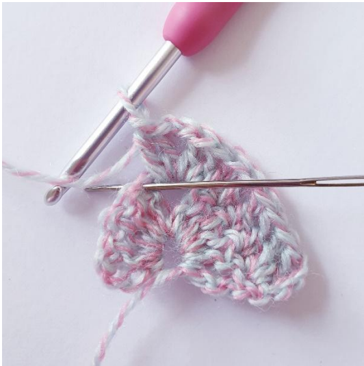
1 p seuraavaan 4 silmukkaan