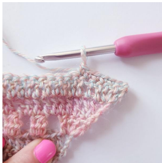
1 ks seuraavaan 6 silmukkaan,