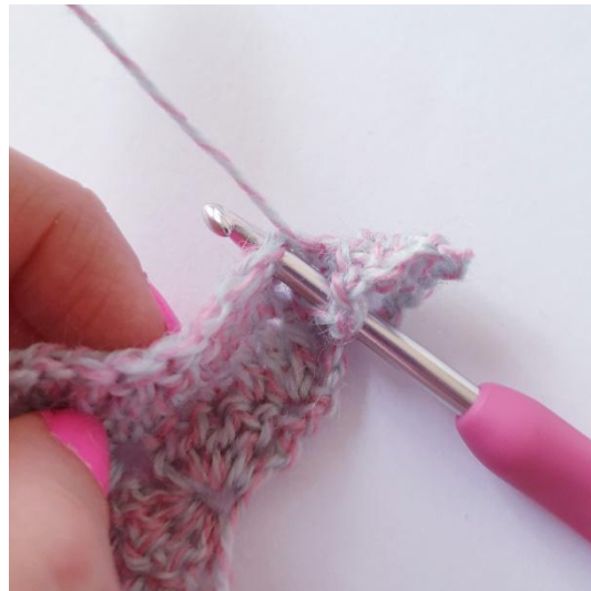
3-pylvään-nyppysilmukka [Vie lanka koukun ympäri ja vie silmukkaan,