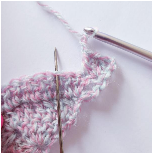
2 kjs, jätä 2 silmukkaa väliin