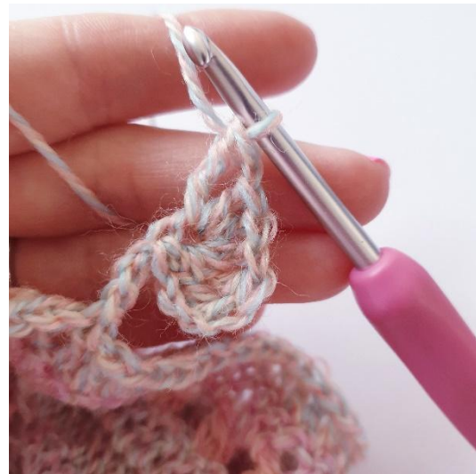
1 kjs, 1 pp,