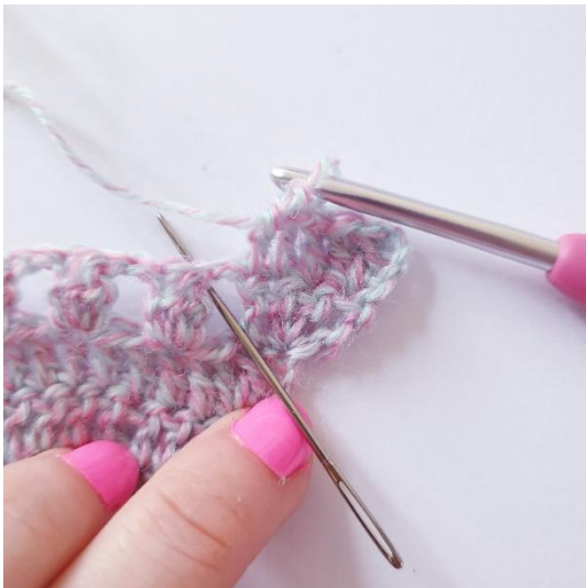
2 p ketjukaareen, 1 p seuraavaan p, toista kärkeen asti