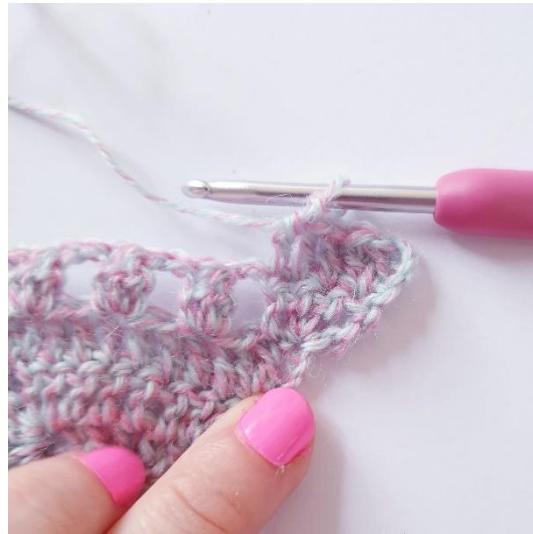
1 p seuraavaan 3 silmukkaan