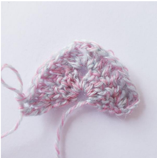
2. kerroksen jälkeen