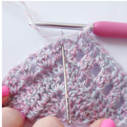
työn kärkeen: [2 p, 2 kjs, 2 p]