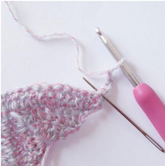
Kerros 4: 2 p ensimmäiseen silmukkaan