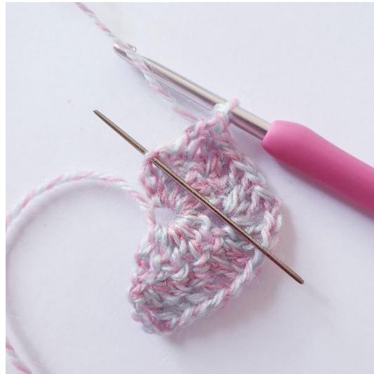
[2 p, 1 pp] käännösketjuun.