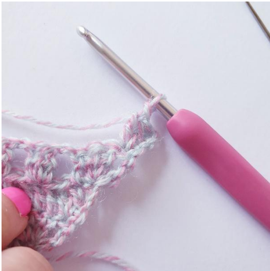
2 p ensimmäiseen silmukkaan