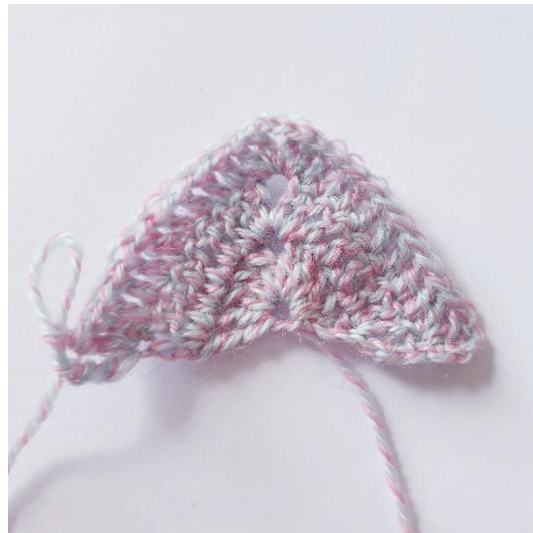
3. kerroksen jälkeen