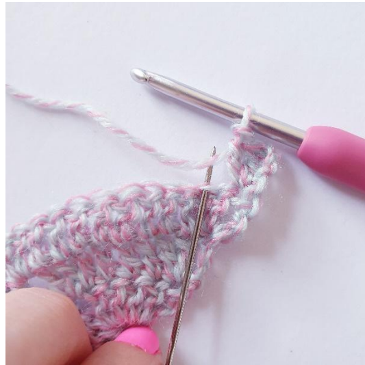
1 p seuraavaan silmukkaan