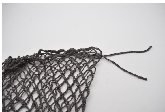
4. Pujota nyöri pussin suun ympäri.