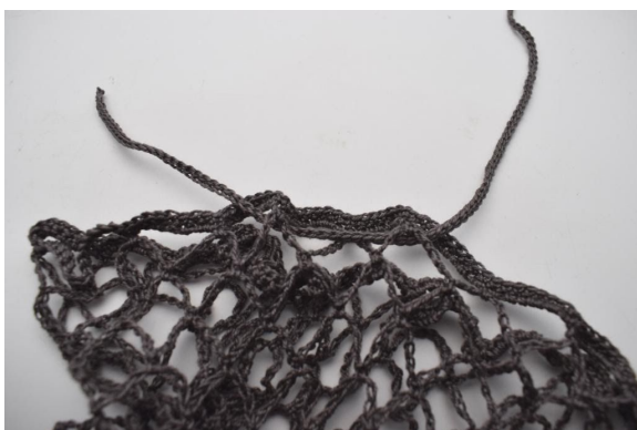
3. Kas näin.