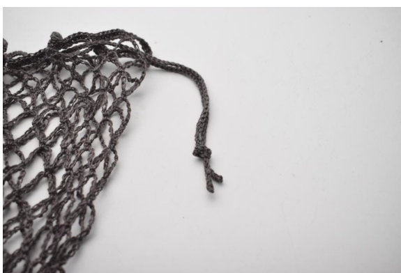
5. Solmi nyörin päät.