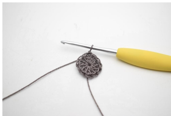
2. Virkkaa al:iin 11 p. Sulje kerros virkkaamalla ps alusta lukien kolmanteen kjs:aan. (12 p)