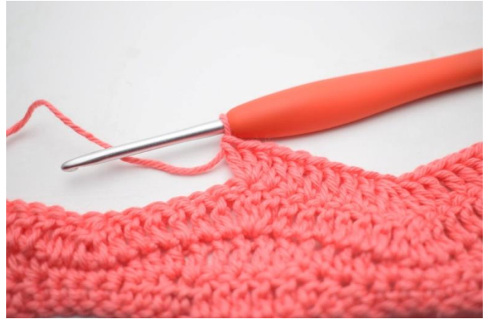
14. Virkkaa 3 p samaan s:aan.