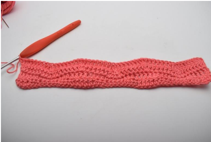
15. Toista. Virkkaa "1 p seuraaviin 6 s:aan, 3 p yhteen, 1 p seuraaviin 6 s:aan ja 3 p seuraavaan s:aan" kerroksen loppuun saakka, mutta virkkaa viimeiseen s:aan vain 2 p.