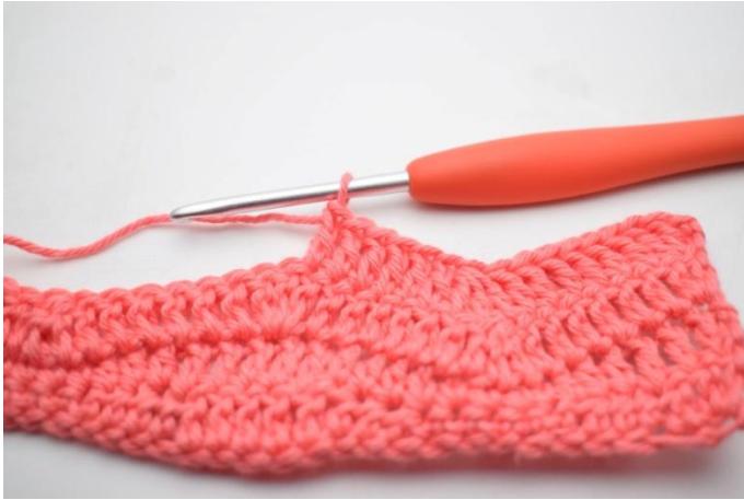
13. Virkkaa 1 p seuraaviin 6 s:aan.