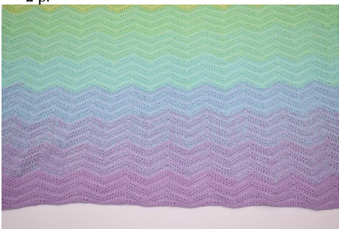
Toista kerrosta 3, kunnes työssä on yhteensä 90 kerrosta.