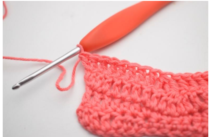
16. Kas näin.