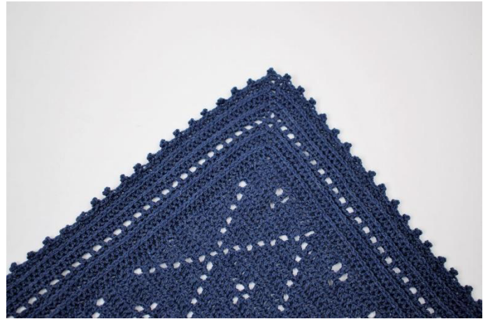
23. Katkaise lanka ja päättelö langanpäät.