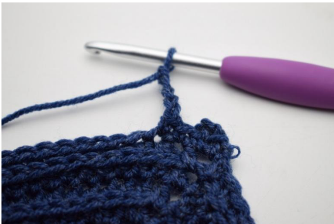
9. Luo 4 kjs.