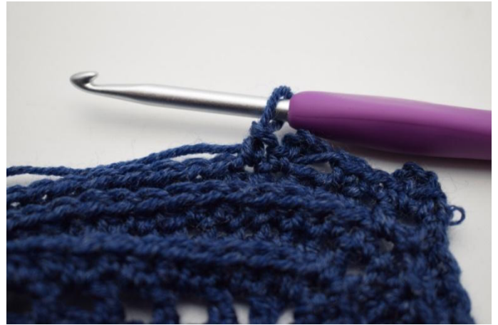
14. "Virkkaa 1 ks seuraavaan silmukkaan.