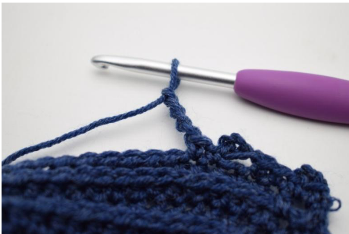
15. Luo 4 kjs.