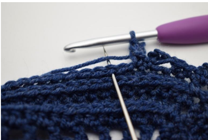
17. Jätä 1 silmukka väliin ja Virkkaa 1 ks seuraavaan silmukkaan".