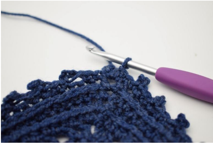
22. Päättelö luomalla 1 ps kerroksen alun ensimmäiseen ks.