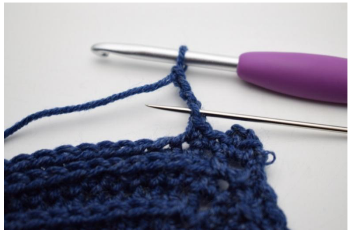
10. Virkkaa 1 ps ensimmäiseen ketjusilmukkaan.