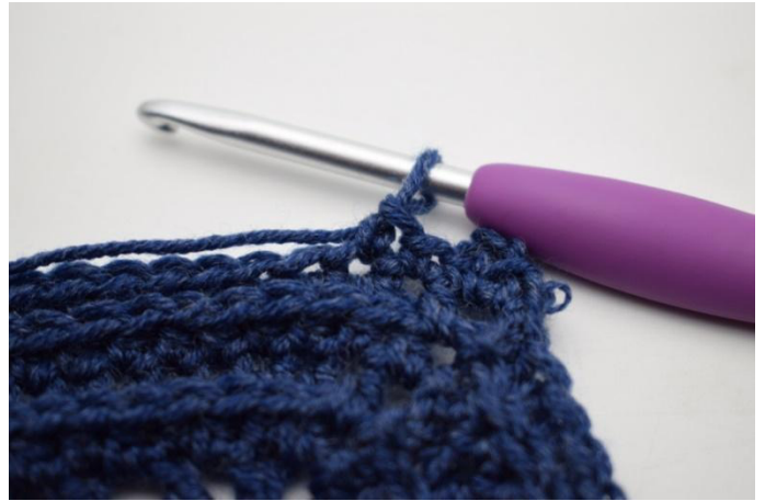
8. "Virkkaa 1 ks seuraavaan silmukkaan.