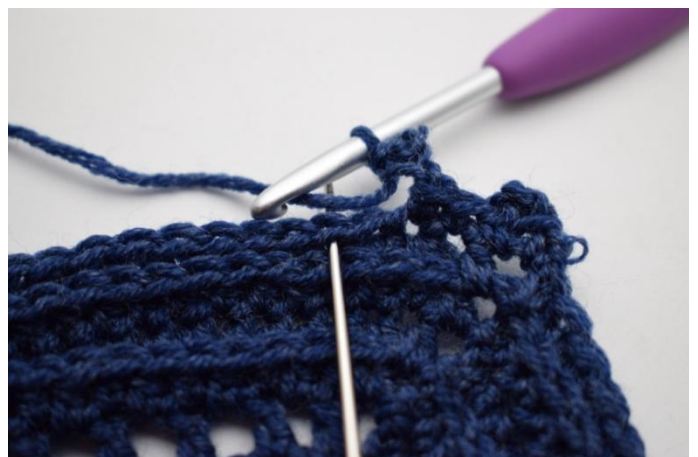
12. Jätä 1 silmukka väliin ja virkkaa 1 ks seuraavaan silmukkaan".