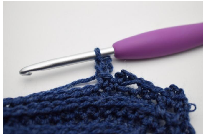
16. Virkkaa 1 ps ensimmäiseen ketjusilmukkaan.