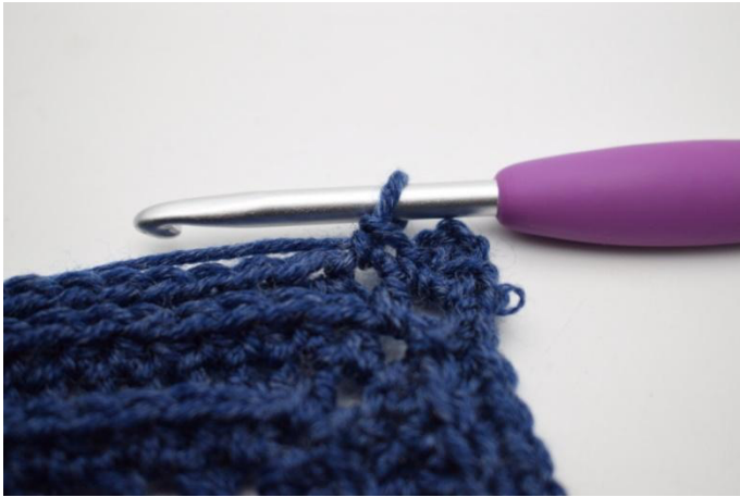
7. (Virkkaa 1 ks ensimmäiseen silmukkaan.