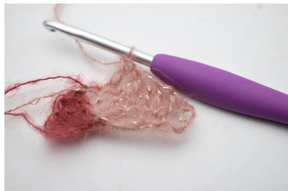
8. virkkaa 1 p seuraavaan 3 silmukkaan.