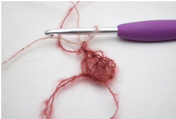
3. Vaihda väriksi 2. Luo 1 kjs.