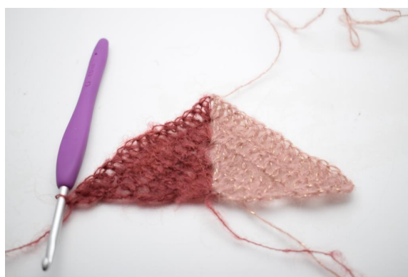
31. virkkaa 2 p ja 1 pp viimeiseen silmukkaan.