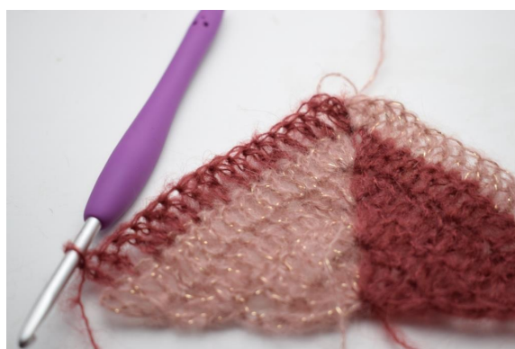
37. virkkaa 1 p seuraavaan 15 silmukkaan.