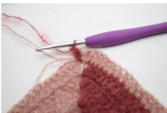
36. Vaihda väriksi 1. Luo 1 kjs, virkkaa 2 p lisää ketjukaareen.