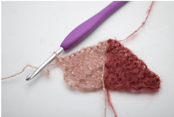
23. virkkaa 1 p seuraavaan 7 silmukkaan.