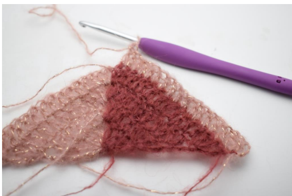
34. virkkaa 1 p seuraavaan 15 silmukkaan.