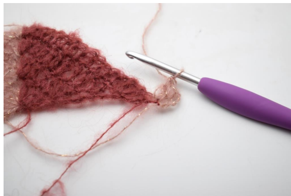
33. Vaihda väriksi 2. Luo 4 kjs, virkkaa 2 p ensimmäiseen silmukkaan