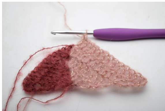
27. virkkaa 1 p seuraavaan 11 silmukkaan.