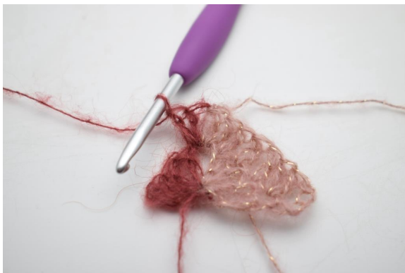
11. Vaihda väriksi 1. Luo 1 kjs, virkkaa 2 p lisää ketjukaareen.