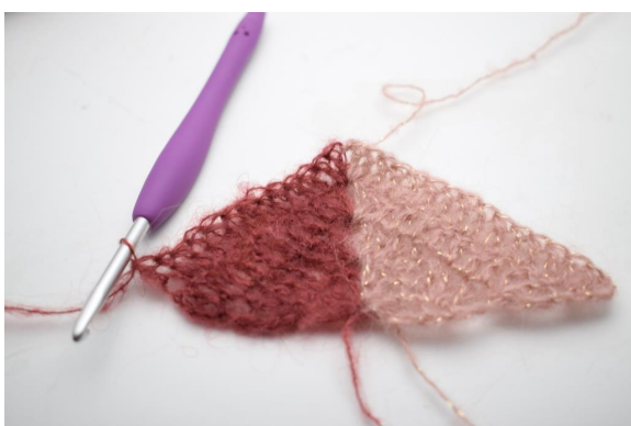
30. virkkaa 1 p seuraavaan 11 silmukkaan.