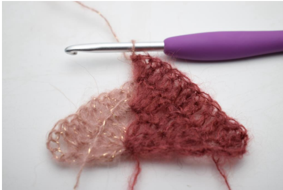
21. Vaihda väriksi 2. Luo 1 kjs, virkkaa 2 p lisää ketjukaareen.