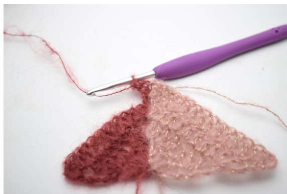
29. Vaihda väriksi 1. Luo 1 kjs, virkkaa 2 p lisää ketjukaareen.