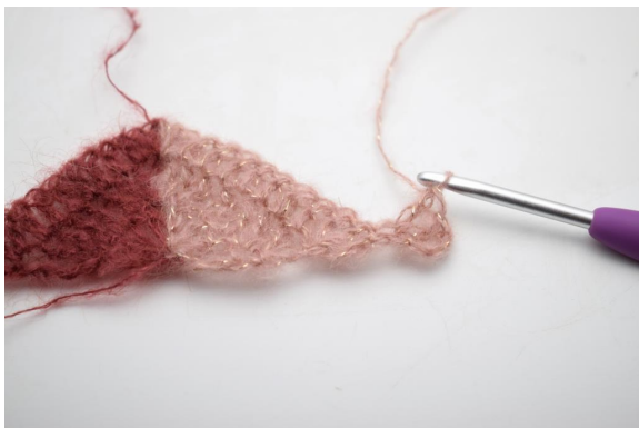
26. Käänny luomalla 4 kjs. virkkaa 2 p ensimmäiseen silmukkaan