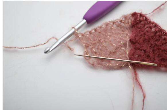
24. virkkaa 2 p ja 1 pp viimeiseen silmukkaan.