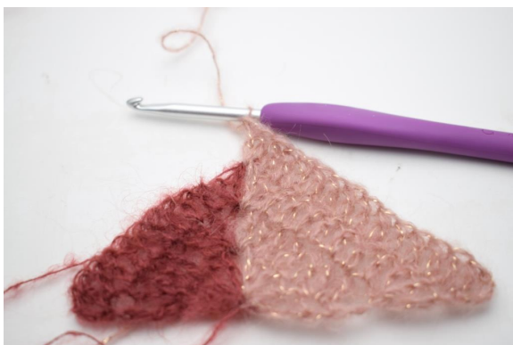
28. virkkaa 2 p ja 1 kjs ketjukaareen.