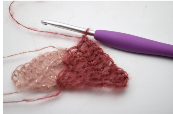
18. virkkaa 1 p seuraavaan 7 silmukkaan.