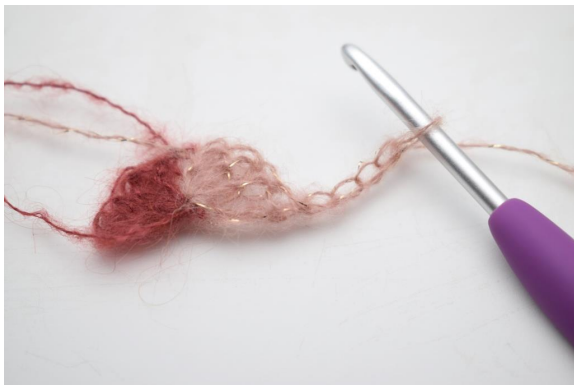
5. Käännä luomalla 4 kjs.