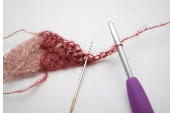
16. virkkaa 2 p ensimmäiseen silmukkaan