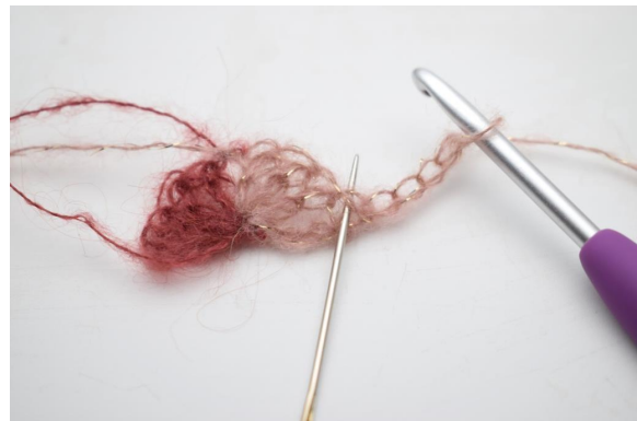
6. virkkaa 2 p ensimmäiseen silmukkaan