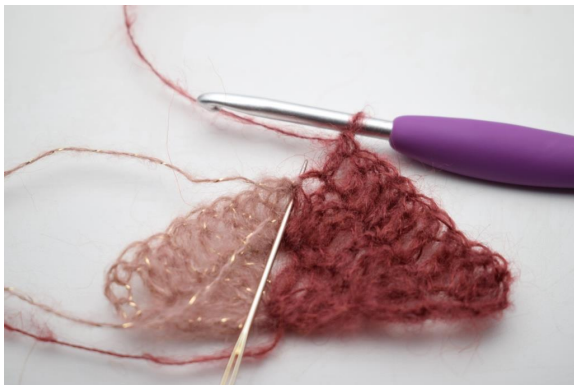
19. virkkaa 2 p ja 1 kjs ketjukaareen.