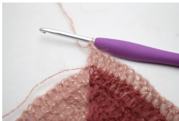
35. virkkaa 2 p ja 1 kjs ketjukaareen.