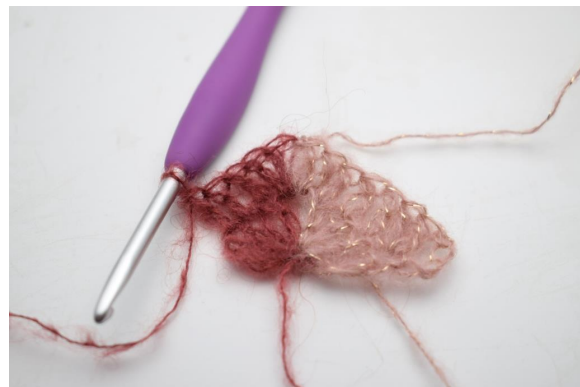
12. virkkaa 1 p seuraavaan 3 silmukkaan.