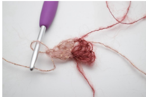
4. virkkaa 3 p ja 1 pp AL