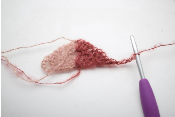
15. Käänny luomalla 4 kjs.