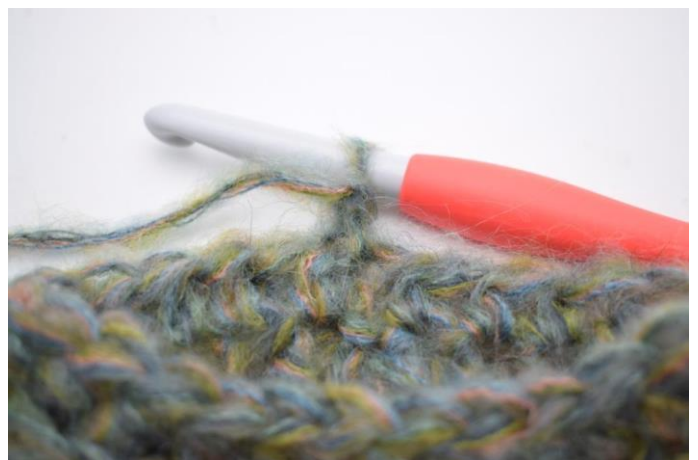
13. Käännä työ.