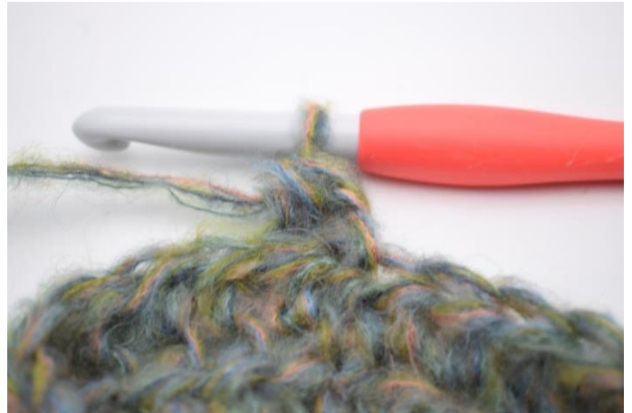
10. Työ näyttää nyt tältä.