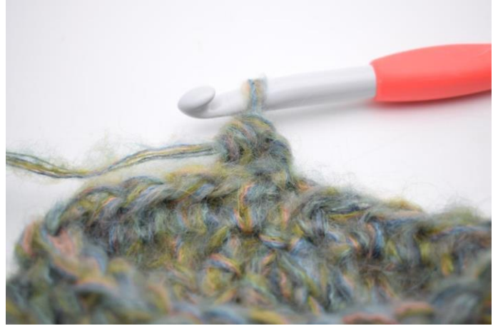
15. Työ näyttää nyt tältä.