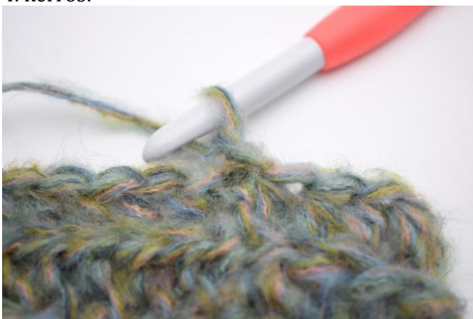
12. Tämä kerros virkataan samalla tavalla kuin edellinen kerros. Virkkaa 1 kjs.