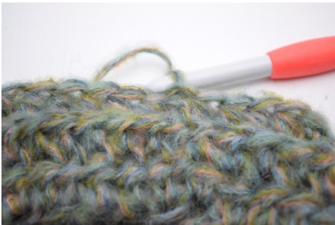
11. Virkkaa ½-p kerroksen jokaisen s:n takimmaiseen lenkkiin. Päätä virkkaamalla 1 ps ensimmäiseen ½-p:aan. (58)