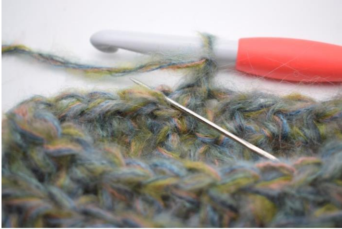
14. Virkkaa 1 ½-p ensimmäisen s:n takimmaiseen lenkkiin.