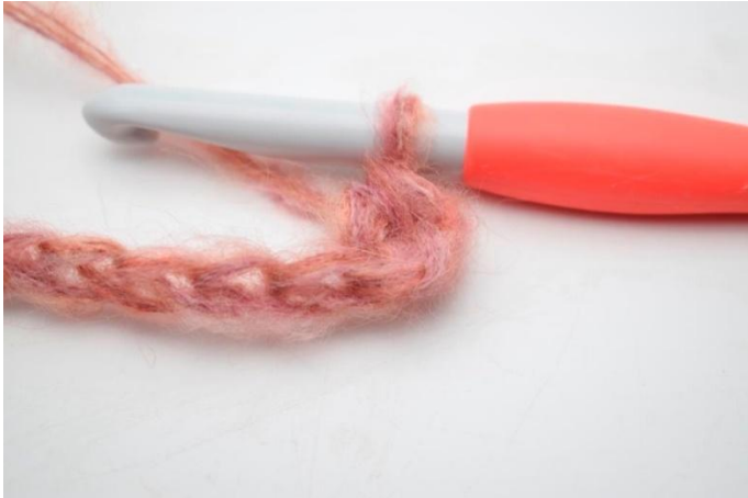
3. Työ näyttää nyt tältä.