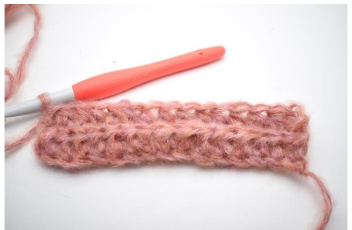
4. Virkkaa ½-p kerroksen jokaisen s:n takimmaiseen lenkkiin. (180)