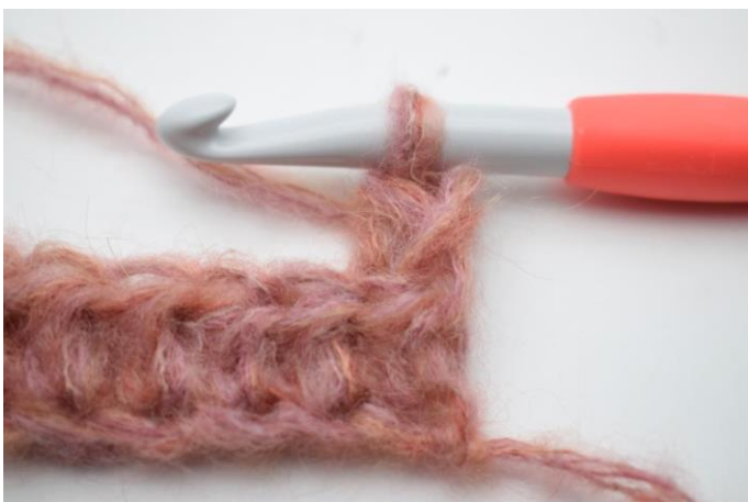
3. Työ näyttää nyt tältä.