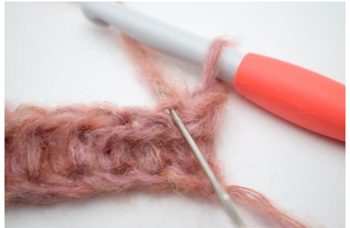
2. Virkkaa 1 ½-p silmukan takimmaiseen lenkkiin. Silmukan paikka on kuvassa neulan osoittamassa kohdassa.