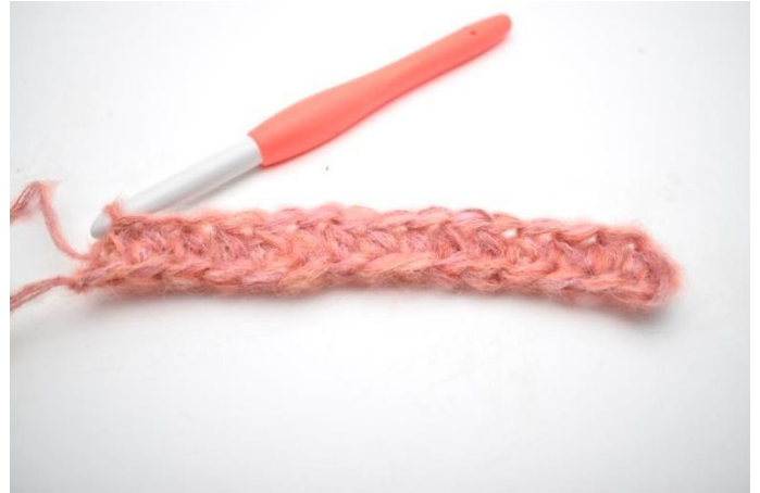
4. Virkkaa ½-p kerroksen jokaiseen s:aan. (180)