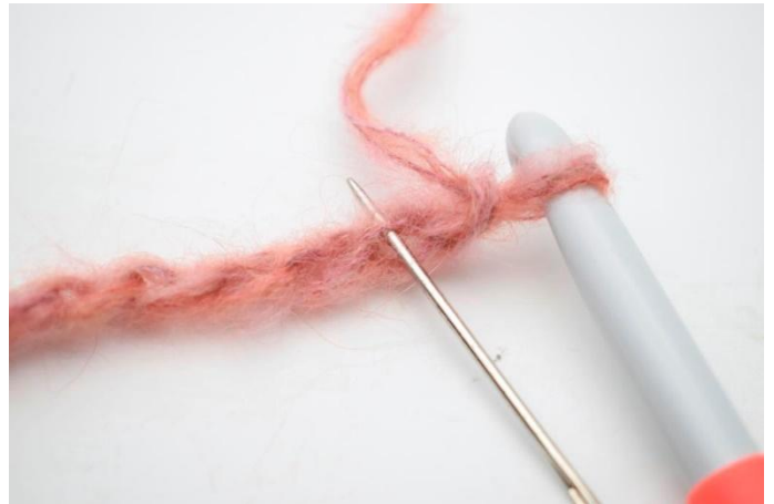
2. Käännä silmukkaketjua niin, että vaakasuorat lenkit tulevat esiin. Virkkaa 1 ½-p koukusta lukien 2. lenkkiin.