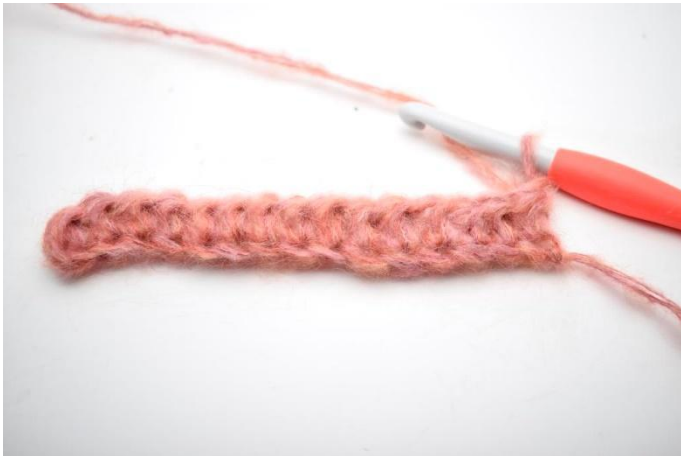
1. Käännä työ virkkaamalla 1 kjs.