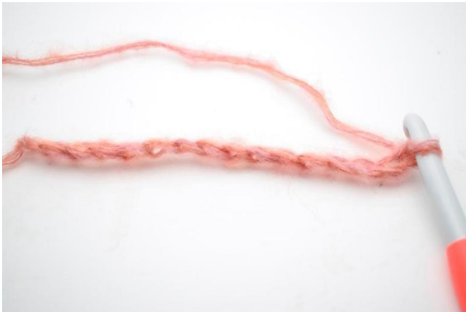
1. Virkkaa 180 kjs.