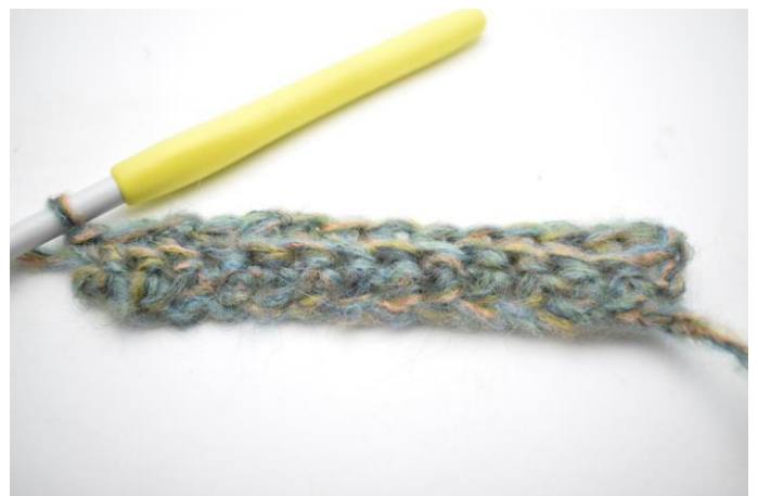
1. Virkkaa ks kerroksen jokaisen s:n takimmaiseen lenkkiin = 49(52)55 m.