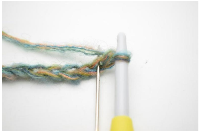
2. Virkkaa 1 ks kougusta lukien 2. kjs:aan.