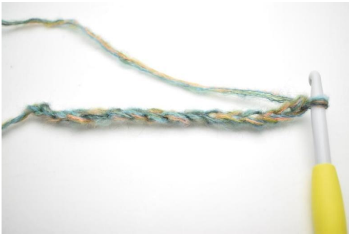
1. Virkkaa 50 (53) 56 kjs.