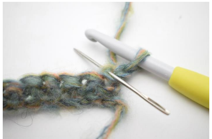
2. Virkkaa 1 ks silmukan takimmaiseen lenkkiin. Silmukan paikka on kuvassa neulan osoittamassa kohdassa.