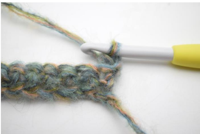
3. Työ näyttää nyt tältä.