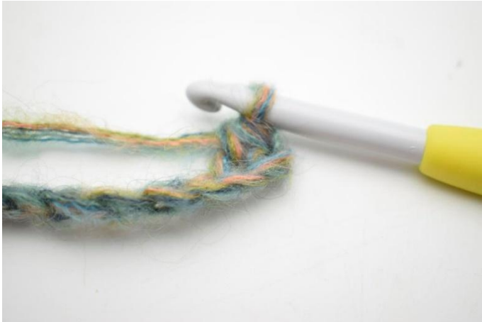
3. Työ näyttää nyt tältä.