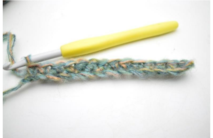
4. Virkkaa ks kerroksen jokaiseen s:aan. = 49 (52) 55 s.