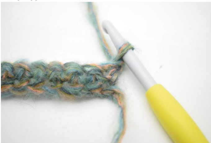
1. Käännä työ virkkaamalla 1 kjs.