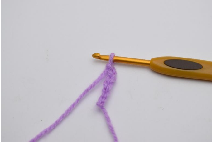
1. Aloita luomalla 6 kjs.