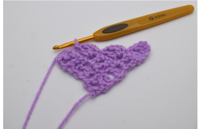
6. Virkkaa 3 kjs ja sitten 1 p, 1 kjs ja 1 p siihen kjs-kaareen, johon äsken virkkasit 1 ps:n.