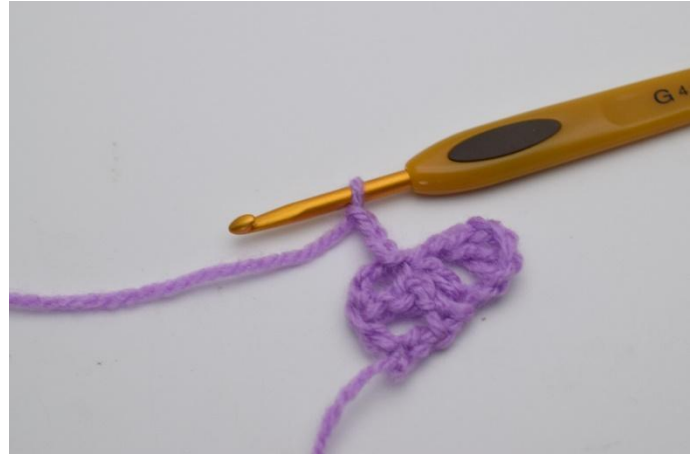
6. Virkkaa 3 kjs.