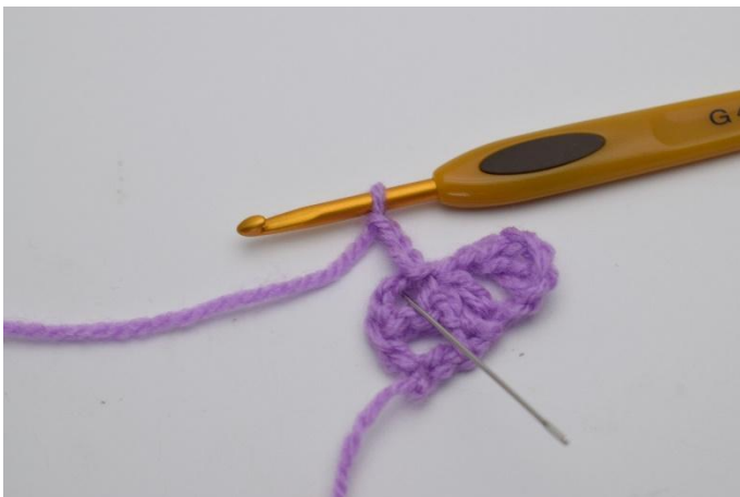
7. Virkkaa "1 p, 1 kjs ja 1 p" siihen neliöön, johon äsken virkkasit 1 ps:n.