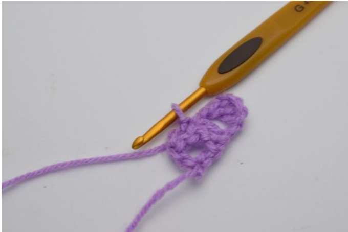
5. Työ näyttää nyt tältä.