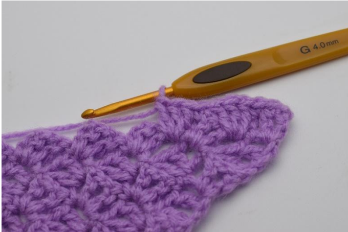
7. Työ näyttää nyt tältä.