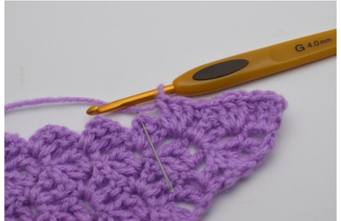
8. Jätä 2 p väliin virkkaa 1 ks kjs-kaareen.