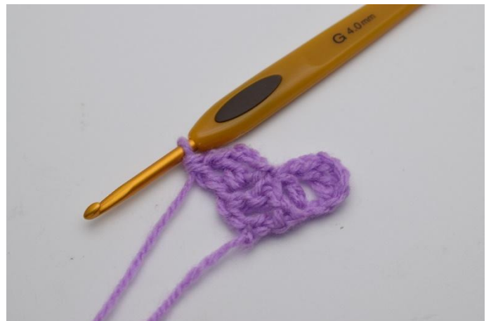
8. Työssä on taas yksi neliö lisää. 2. kerroksella on kaksi neliötä.