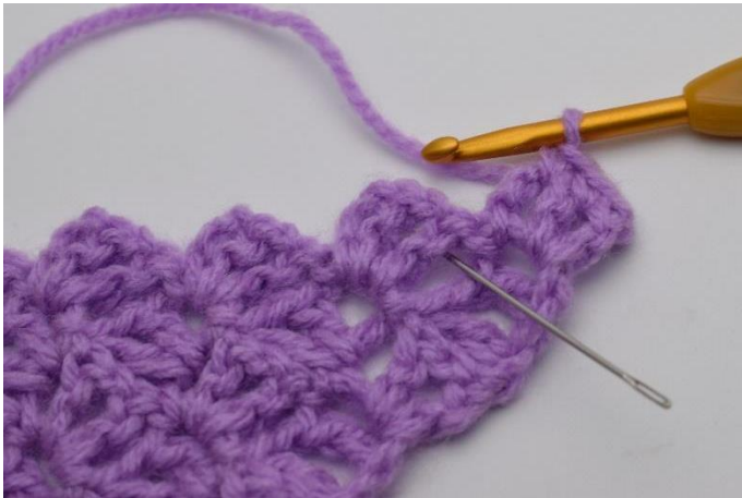
3. Kerros virkataan kahden edellisen kerroksen neliöiden väliin. Kuvan neula näyttää silmukan paikan.