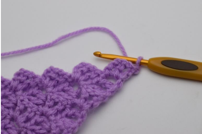
1. Käännä työ virkkaamalla 1 kjs.