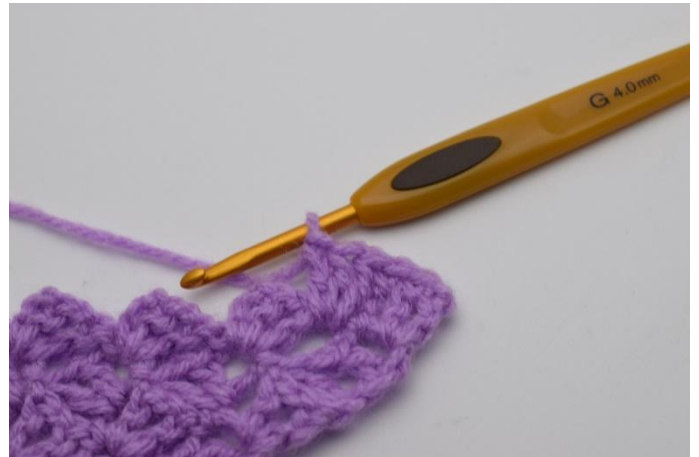
4. Virkkaa 3 p.