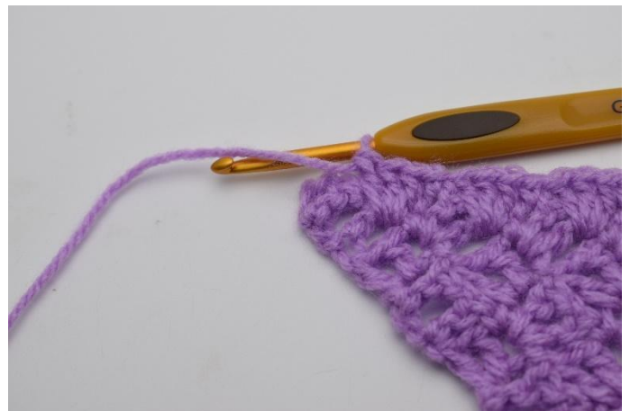
10. Toista kerroksen loppuun saakka.