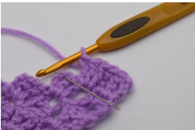
5. Jätä 2 p väliin virkkaa 1 ks kjs-kaareen.