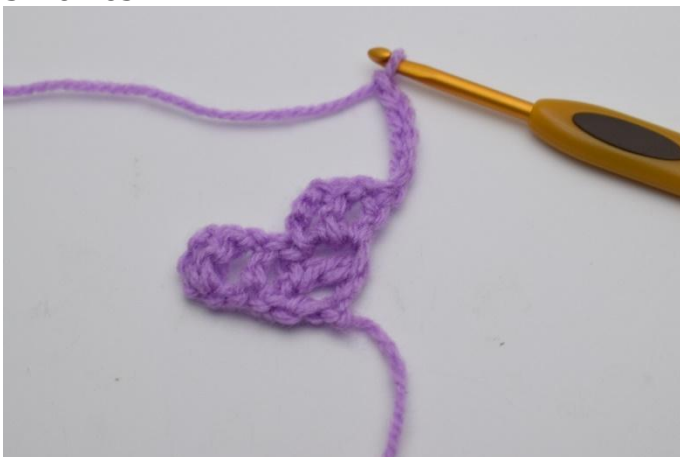
1. Käännä työ ja virkkaa 6 kjs.