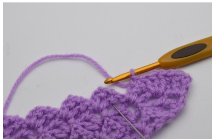
6. Työ näyttää nyt tältä. Virkkaa 3 p kahden edellisen kerroksen neliöiden väliin. Kuvan neula näyttää silmukan paikan.