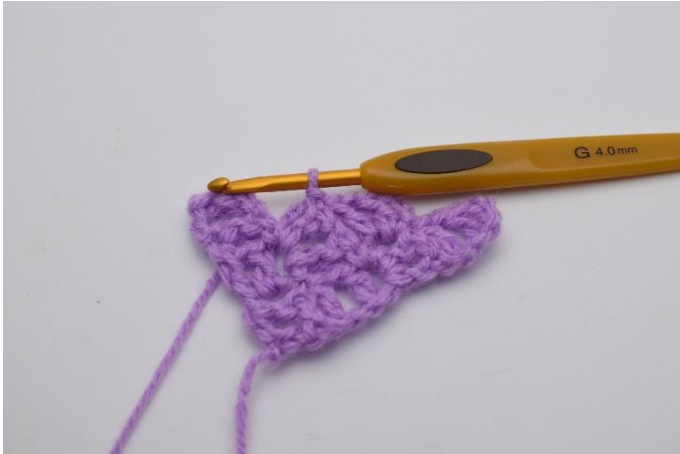
5. Virkkaa alla olevaan neliöön 1 ps.