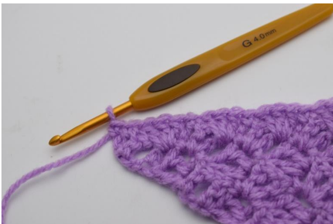
11. Päätä virkkaamalla 1 ks viimeiseen p:aan. Katkaise lanka ja päättele langanpäät.