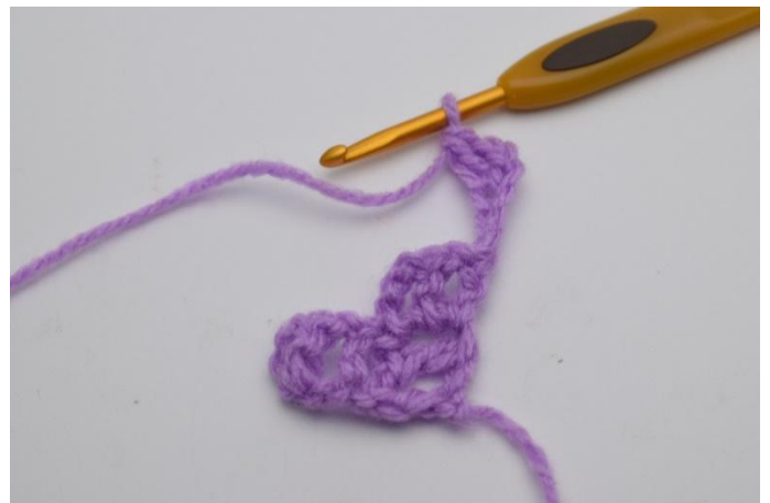
2. Virkkaa 1 p koukusta lukien 4. kjs:aan