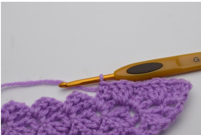
9. Työ näyttää nyt tältä.