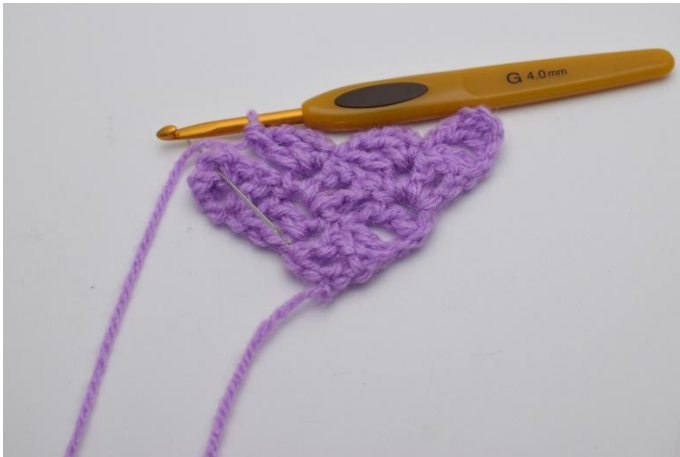
7. Virkkaa alla olevaan neliöön 1 ps.