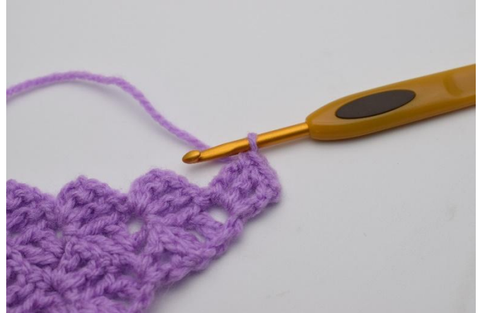
2. Virkkaa 1 ks 2 p:n ryhmään.