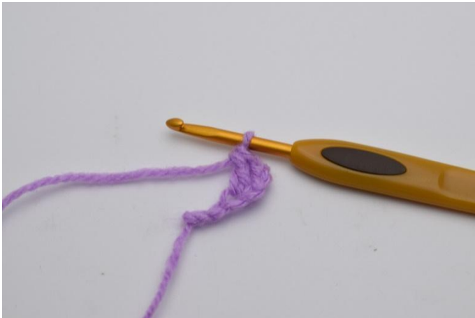
3. Kas näin.