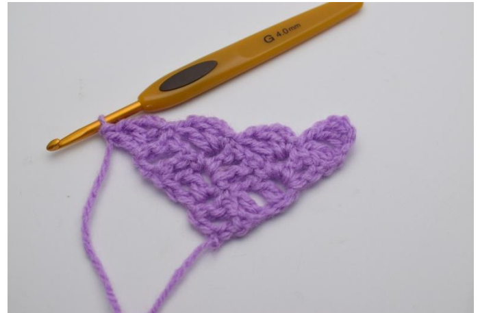
8. Virkkaa 3 kjs ja sitten 1 p, 1 kjs ja 1 p siihen kjs-kaareen, johon äsken virkkasit 1 ps:n.