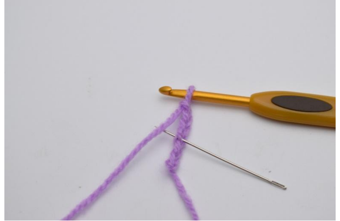
2. Virkkaa koukusta lukien 4. kjs:aan 1 p.