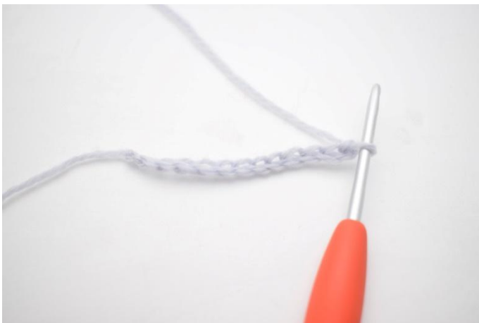
1. Virkkaa 25 kjs.