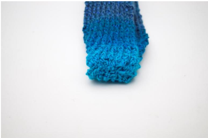
7. Ompele kappaleiden päät yhteen kaikkien neljän kerroksen läpi. Katkaise lanka ja päättele langanpäät.