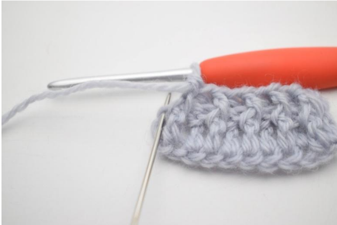
9. Virkkaa 1 tavallinen p viimeiseen s:aan.