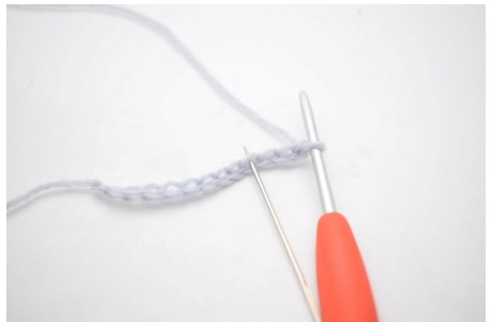
2. Virkkaa 1 p koukusta lukien 4. kjs:aan