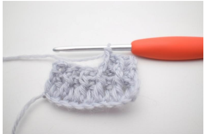
6. "Virkkaa 1 tkp ensimmäisen s:n ympärille, virkkaa 1 ekp seuraavan s:n ympärille".