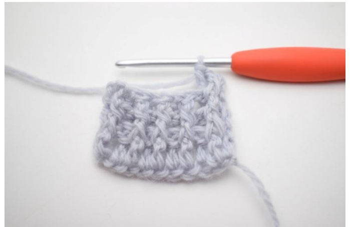
2. "Virkkaa 1 ekp ensimmäisen s:n ympärille, virkkaa 1 tkp seuraavan s:n ympärille".