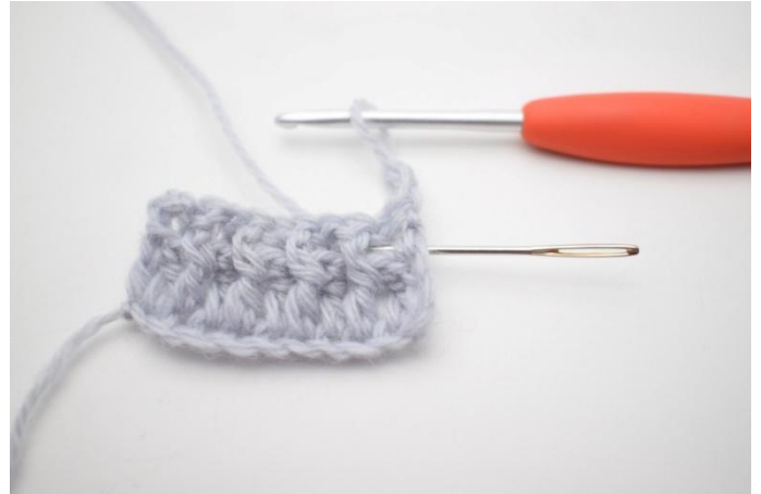
2. Virkkaa 1 tkp ensimmäisen s:n ympärille. Tkp on koholla oleva pylväs, joka virkataan takakautta edellisen kerroksen pylvään ympärille neulan osoittamasta kohdasta.