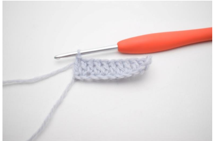
4. Virkkaa p kerroksen jokaiseen s:aan. (23)