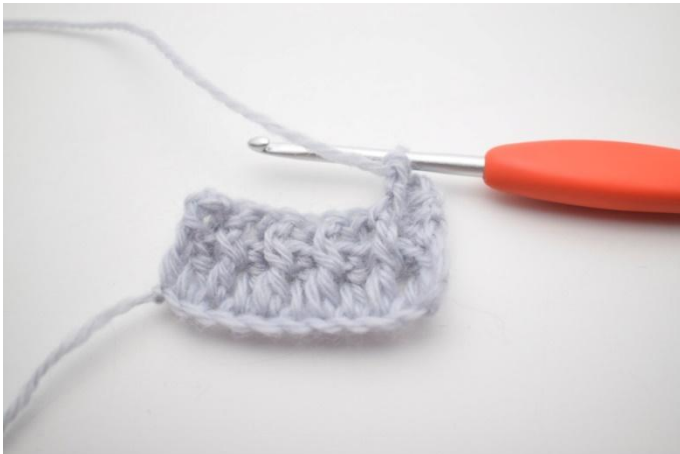
5. Kas näin.