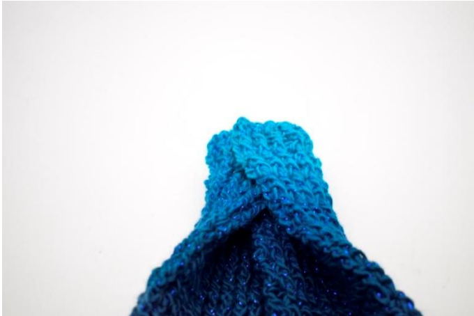
5. Taita vasemman puolen toinen puolikas oikean puolen päälle.