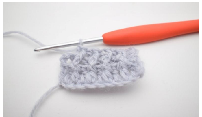
8. Virkkaa 1 tkp seuraavan s:n ympärille.