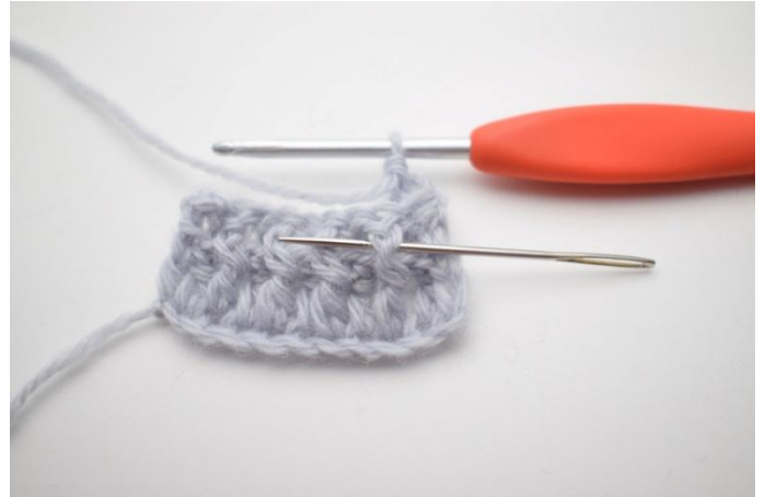
4. Virkkaa 1 ekp seuraavan s:n ympärille. Ekp on koholla oleva pylväs, joka virkataan etukautta edellisen kerroksen pylvään ympärille neulan osoittamasta kohdasta.