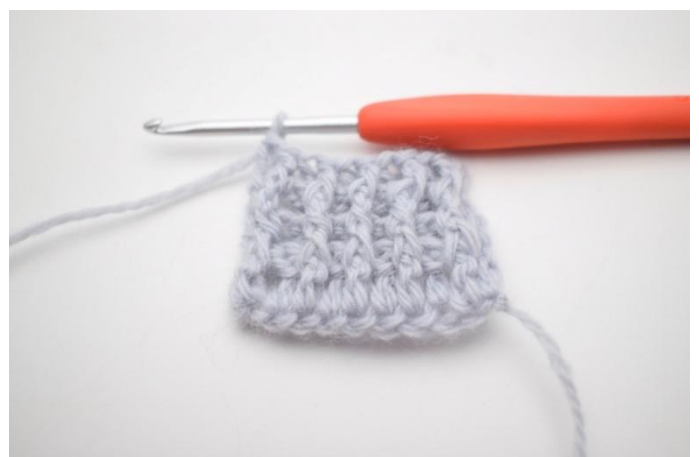
4. Virkkaa 1 ekp seuraavan s:n ympärille. Virkkaa 1 tavallinen p viimeiseen s:aan.