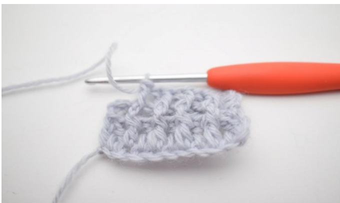
7. Toista "-", kunnes jäljellä on 2 s.