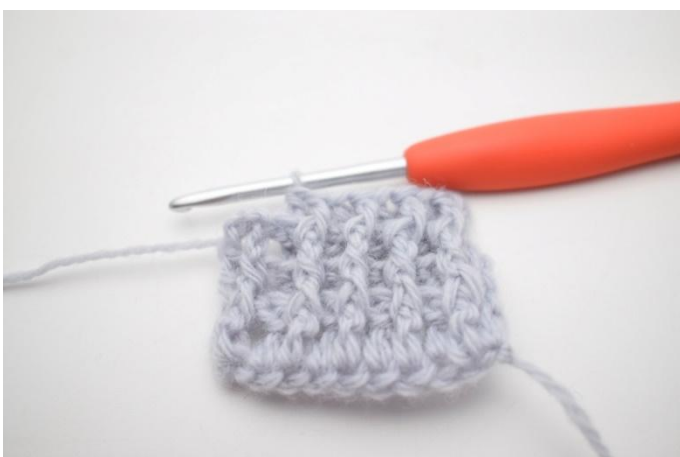
3. Toista "-", kunnes jäljellä on 2 s.