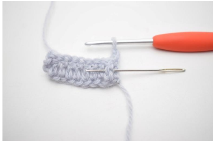
2. Virkkaa 1 ekp ensimmäisen s:n ympärille. Ekp on koholla oleva pylväs, joka virkataan etukautta edellisen kerroksen pylvään ympärille neulan osoittamasta kohdasta.