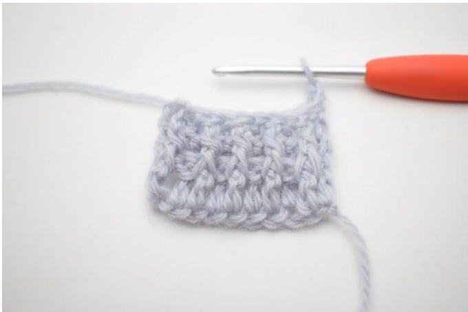
1. 3. kerros virkataan samalla tavalla, kuin edellinen kerros. Käännä työ virkkaamalla 3 kjs.