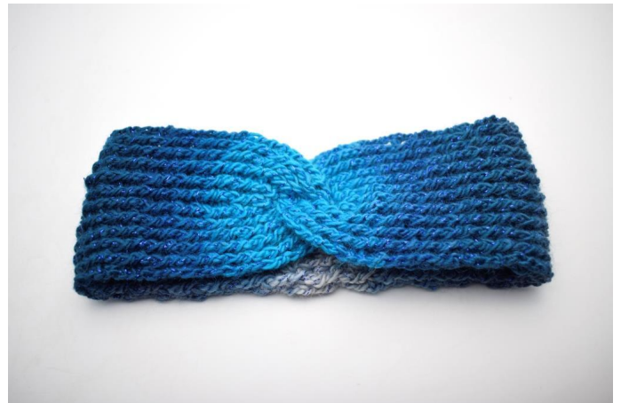
8. Käänä työ ympäri niin, että ommel tulee nurjalle puolelle. Pannassa on nyt sievä ”solmu” ja se on valmis 😊