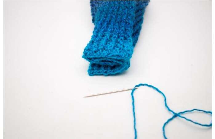
6. Kappaleiden päät on nyt taiteltu yhteen kuvan mukaisesti.