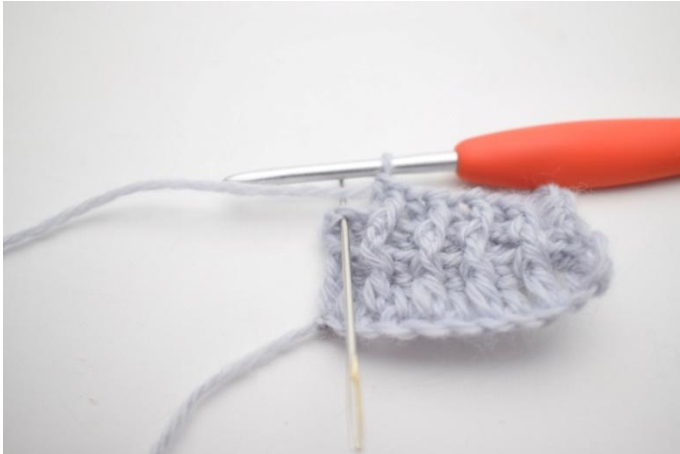
9. Virkkaa 1 tavallinen p viimeiseen s:aan.