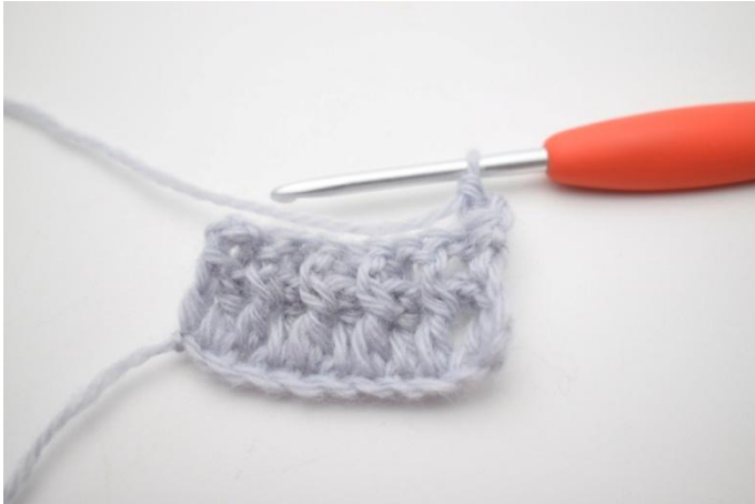
3. Kas näin.