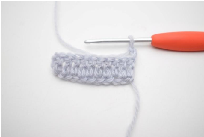
1. Käännä työ virkkaamalla 3 kjs.