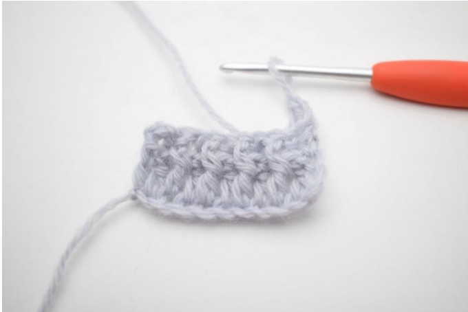
1. Käännä työ virkkaamalla 3 kjs.