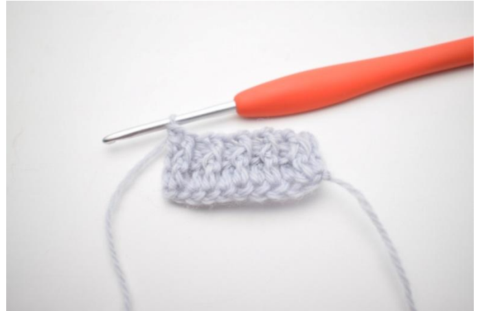
10. Kas näin.