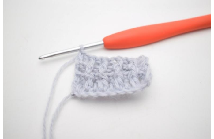
10. Kas näin.