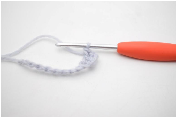
3. Kas näin.