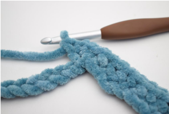
11. Virkkaa 3 ks sitä seuraavaan kjs:aan.”