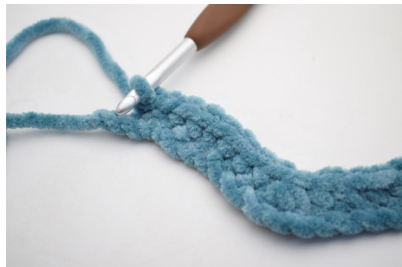
14. Virkkaa 1 ks seuraaviin 8 kjs:aan.