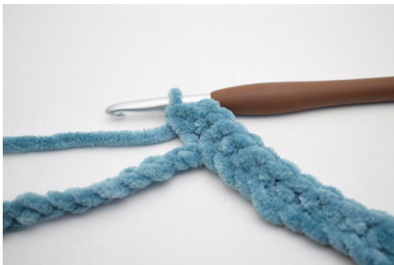
7. Virkkaa 3 ks sitä seuraavaan kjs:aan.