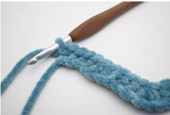
15. Virkkaa 2 ks viimeiseen kjs:aan.