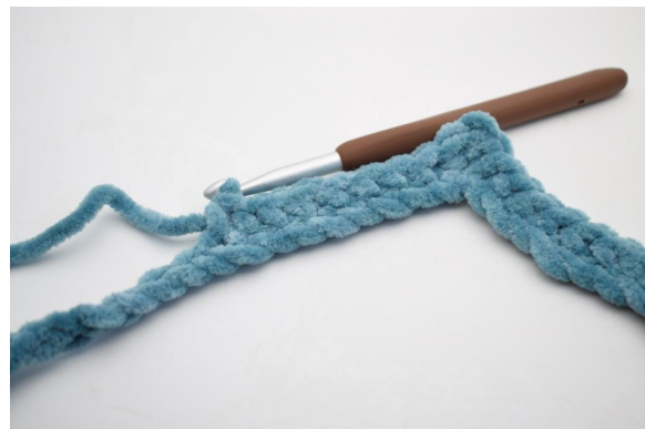
8. "Virkkaa 1 ks seuraaviin 8 kjs:aan.