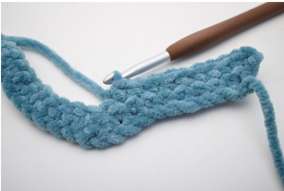
18. "Virkkaa 1 ks seuraaviin 8 s:aan.