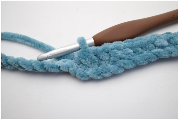
5. Virkkaa 3 ks yht.