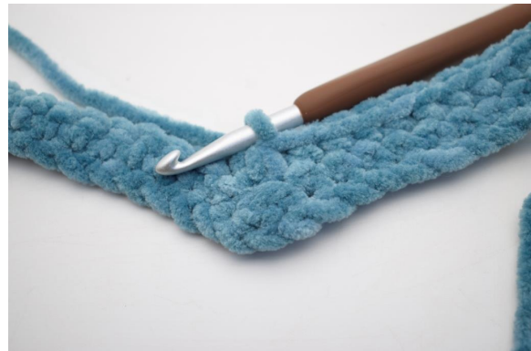
19. Virkkaa 3 ks yht.