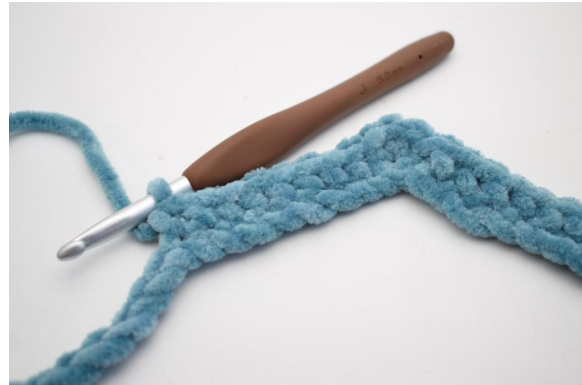
12. Virkkaa 1 ks seuraaviin 8 kjs:aan.