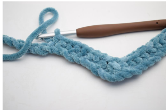
10. Virkkaa 1 ks seuraaviin 8 kjs:aan.