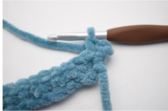
17. Virkkaa 2 ks ensimmäiseen s:aan.