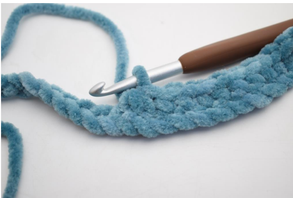
13. Virkkaa 3 ks yht.