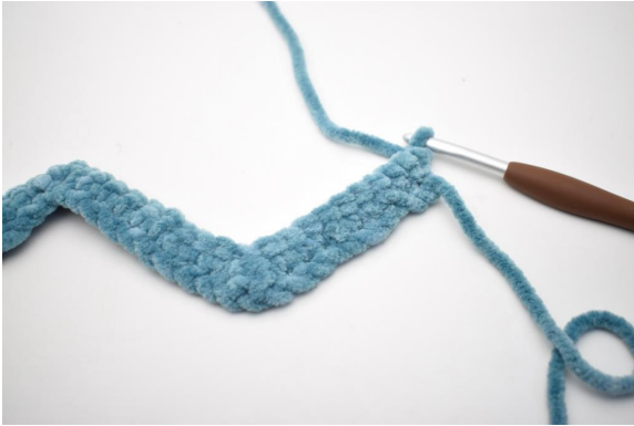
16. Käännä työ virkkaamalla 1 kjs.