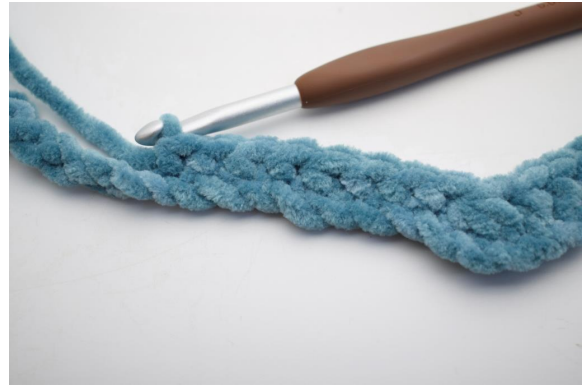
6. Virkkaa 1 ks seuraaviin 8 kjs:aan.