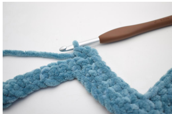
21. Virkkaa 3 ks sitä seuraavaan s:aan."