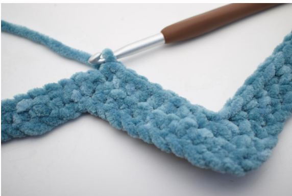
20. Virkkaa 1 ks seuraaviin 8 s:aan.