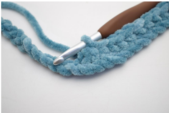
9. Virkkaa 3 ks yht.