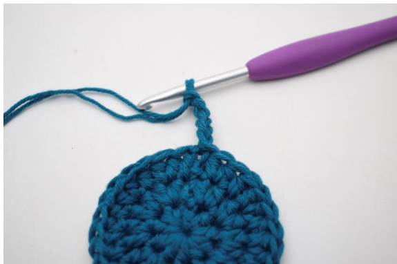
5. "Virkkaa 5 kjs."