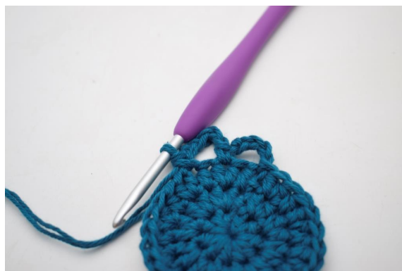
10. Kas näin.