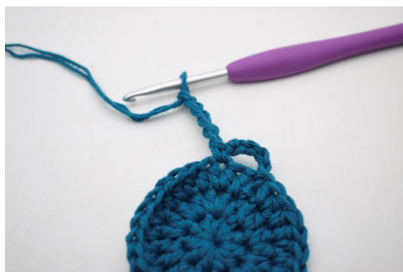
8. "Virkkaa 5 kjs."