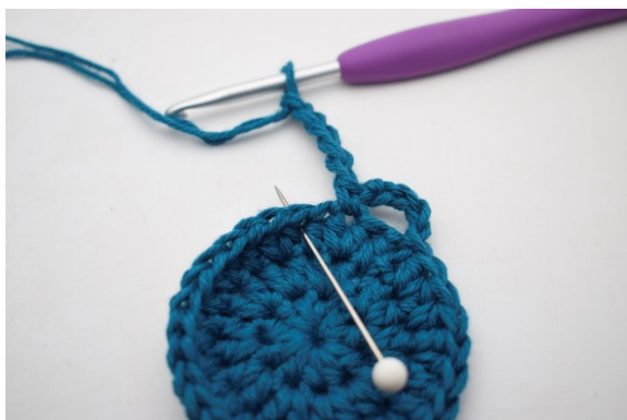
9. Jätä 1 s väliin ja virkkaa 1 ks seuraavaan s:aan."