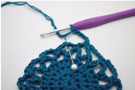
22. "Virkkaa 5 kjs ja virkkaa seuraavaan kjs-kaareen 1 ks."