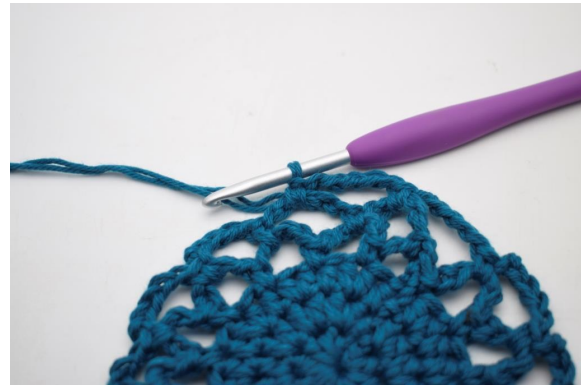
23. Kas näin.