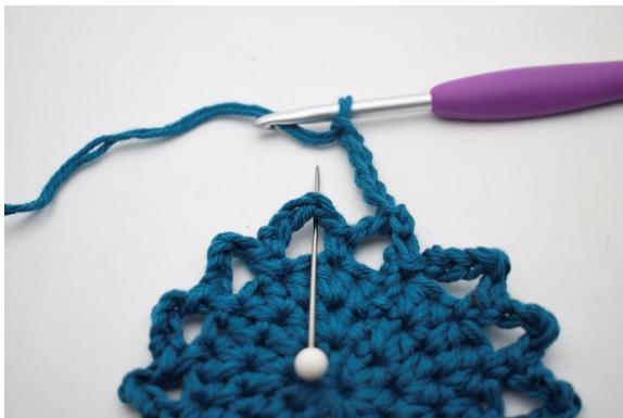
16. "Virkkaa 5 kjs ja virkkaa seuraavaan kjs-kaareen 1 ks."