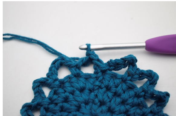
15. Kas näin.