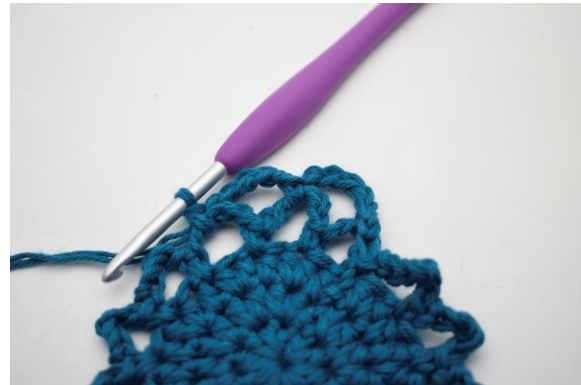
19. Kas näin.