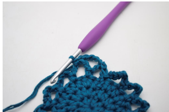
17. Kas näin.