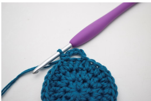
7. Kas näin.