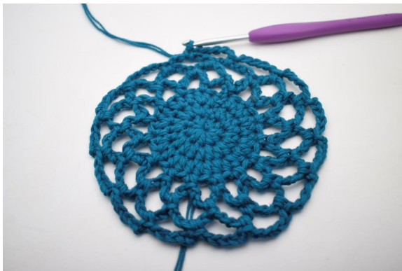
24. Toista "-" kerroksen loppuun asti. (15 kjs-kaarta)