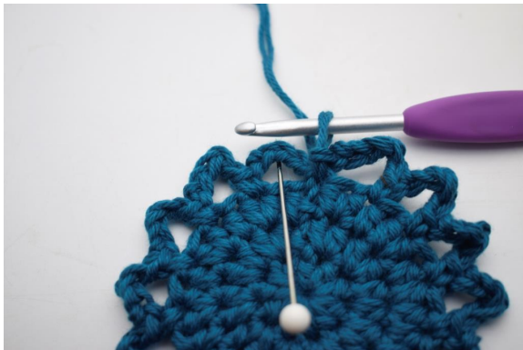
14. Virkkaa 3 ps ensimmäiseen kjs-kaareen niin, että voit aloittaa kaaren keskeltä.