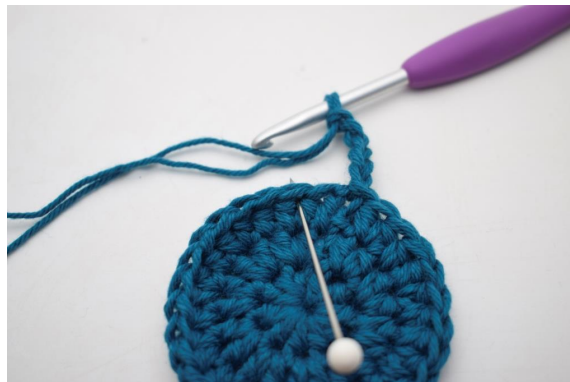
6. Jätä 1 s väliin ja virkkaa 1 ks seuraavaan s:aan."