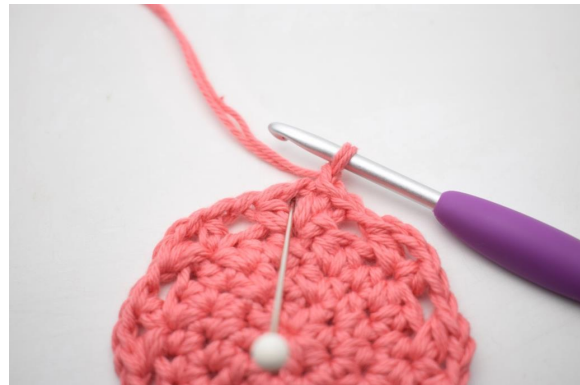
17. "Virkkaa 4 ½-p, 1 kjs ja 4 ½-p ketjukaareen".