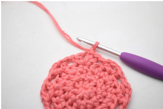
16. Luo 1 kjs.