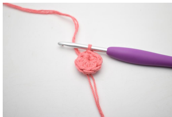
2. Virkkaa 8 ½-p aloituslenkkiin. Päätä luomalla 1 ps. (8).