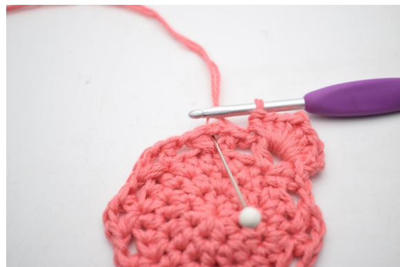
19. "Virkkaa 4 ½-p, 1 kjs ja 4 ½-p ketjukaareen".