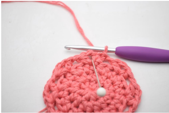
14. Luo ps ensimmäiseen ketjukaareen asti.