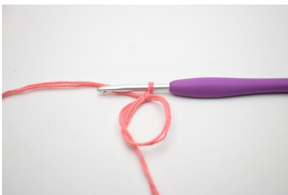
1. Luo Al ja luo siihen 1 kjs.