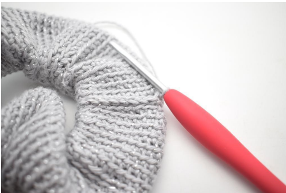
15. Toista koko donitsin ympäri.