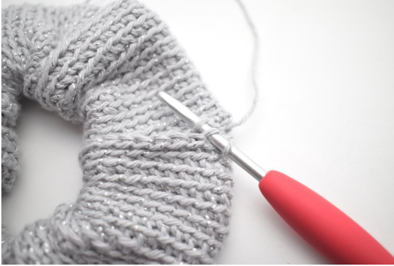
13. Virkkaa 1 ps TR reunuksen silmukoita myöten.