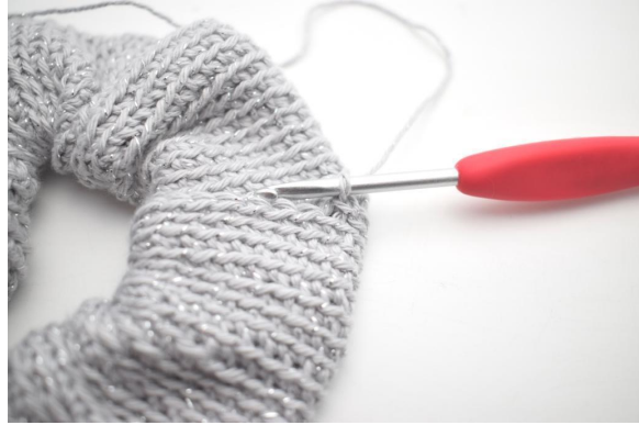
14. Kuten näin