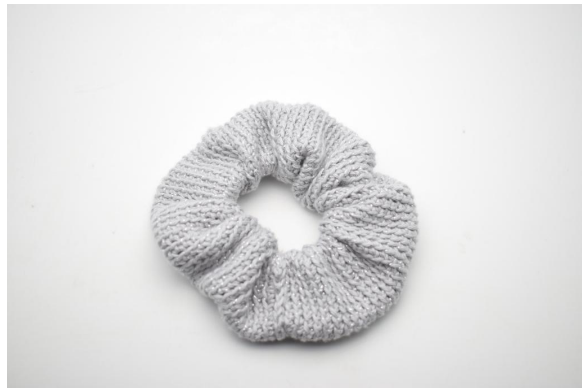
16. Leikkaa lanka ja päättelee langat työhön.