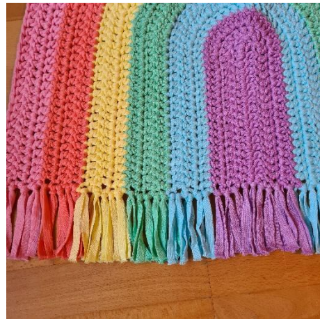
Mukavia virkkaushetkiä! Super Cute Design / Jennifer Santos