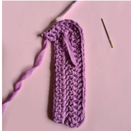
8: [lis] x5,