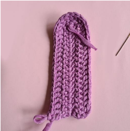
9. 16 p. 1 p kkjs:aan. Käännä työ