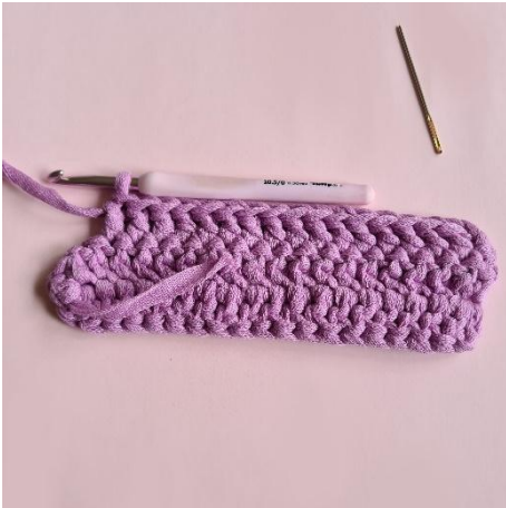
7. 16 p.