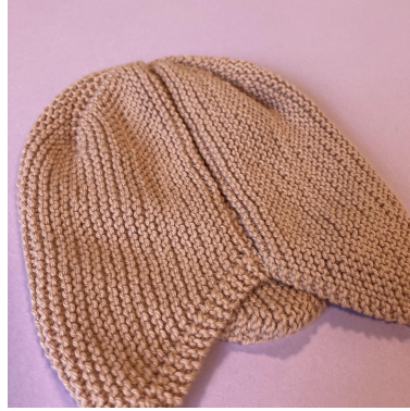
Silmukoiden luontikerroksen ja päätöskerroksen yhteenompelu