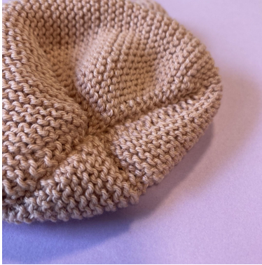
Kappaleiden 1-6 yhteenompelu