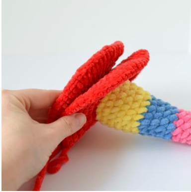
19. Aseta pohja raketin alaosaan