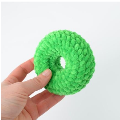
5. Valmis rengas