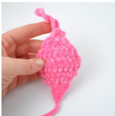
11. Toinen puoliaika on tehty