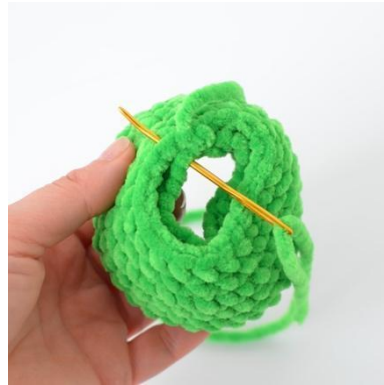
4. Ompele ensimmäinen ja viimeinen kerros yhteen