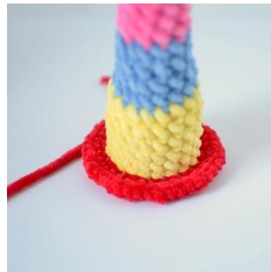
18. Työstä silmukan etureunaan