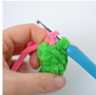
14. Luo ks uudella värillä