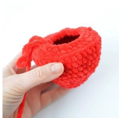
6. Työstä silmukan takareunaan luodaksesi litteän alaosan