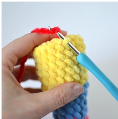
17. Työstä silmukan etureunaan