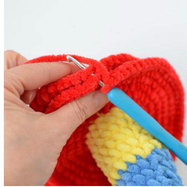
20. Yhdistä osat luomalla ps