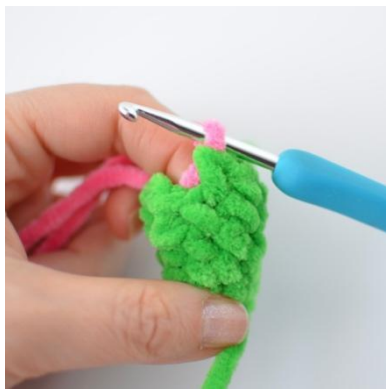
15. Vaihda väriä