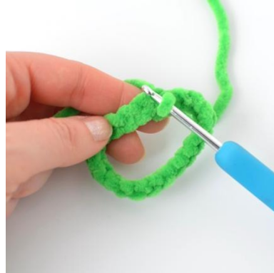
2. Yhdistä ensimmäinen silmukka viimeiseen ja muodosta ympyrä