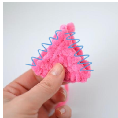
12. Ompele kolmion reunat