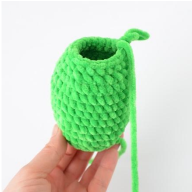
3. Kaikki kerrokset luotu