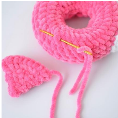
13. Ompele siipi renkaaseen