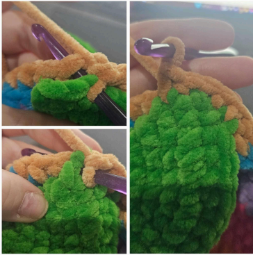
Ensimmäisen takajalan kiinnittäminen