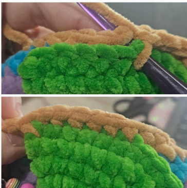
Toisen etujalan kiinnittäminen