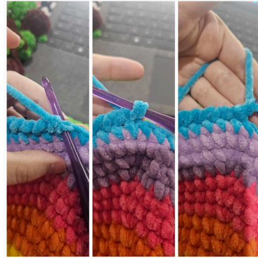
Toisen takajalan kiinnittäminen